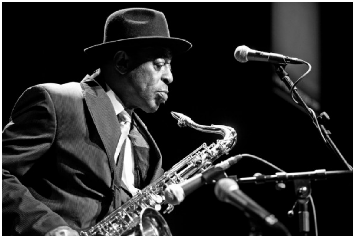
Archie Shepp, Offenburg 2011

Por fin cumplido mi deseo de fotografiar a uno de los músicos que más admiro por su trayectoria musical y por su compromiso con la raza afro-americana y luchador por la obtención de sus legítimos derechos. Estoy hablando de Archie Shepp que tocó en la ciudad alemana Offenburg en dúo junto al gran pianista alemán Joachim Kühn.