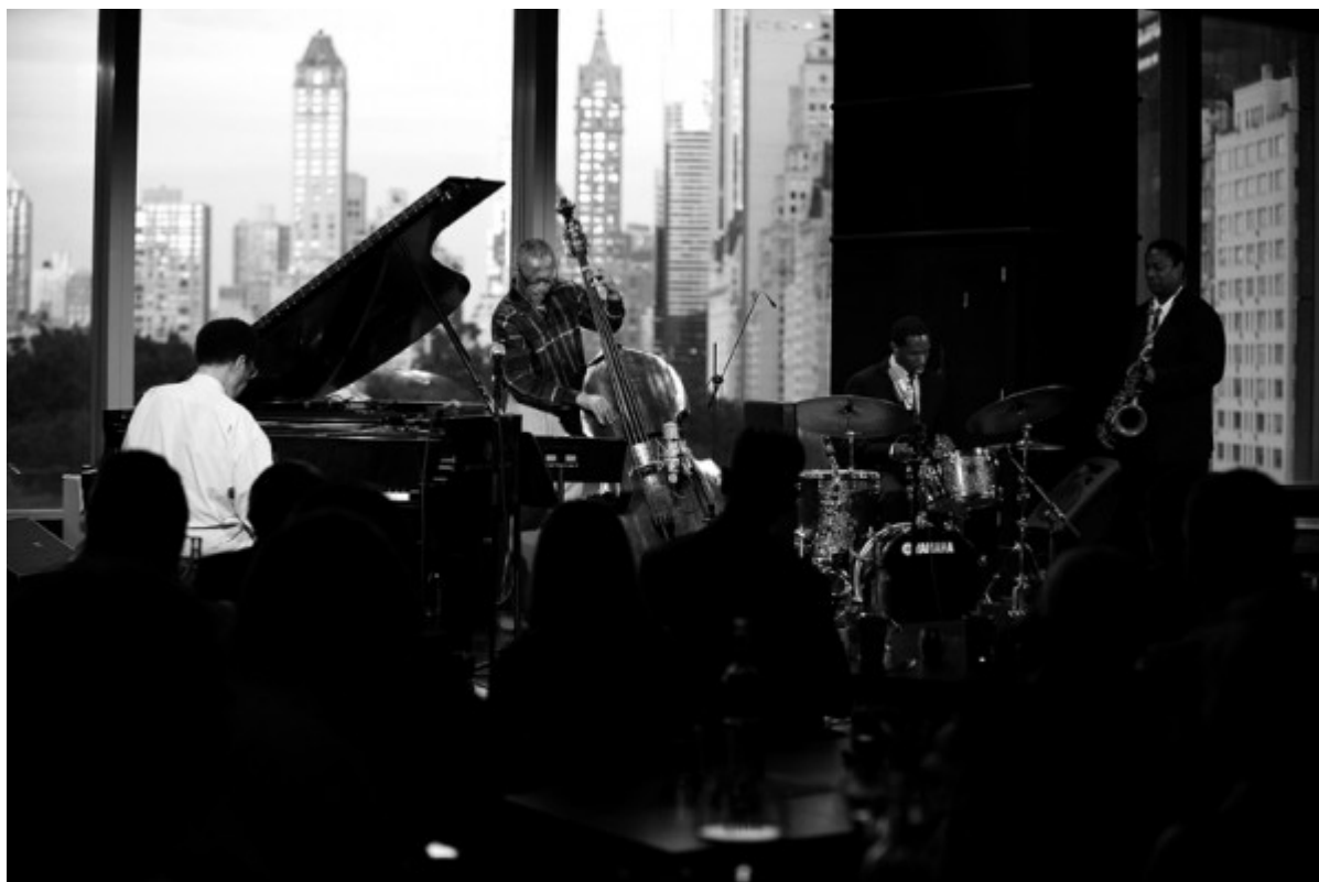
Cedar Walton Quartet © by Esther Cidoncha, New York 2012

Una noche espléndida de verano, en uno de los mejores clubes de jazz de Nueva York, en el Dizzy's Club Jazz Coca-Cola. Vistas impresionantes a Central Park. Conciertazo, copas. Un local más que recomendable. El cuarteto de Cedar Walton tocó como nunca.