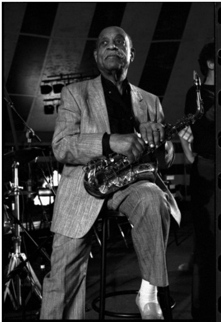
Benny Carter Festival Jazz aux Remparts, Bayonne 1994

Benny Carter pertenece a la leyenda del jazz con derecho propio como de uno de los grandes maestros del jazz. Precisamente le debemos a una de sus muchas y geniales composiciones el título de esta pequeña exposición virtual When Lights Are Low . Espero que la hayáis disfrutado.