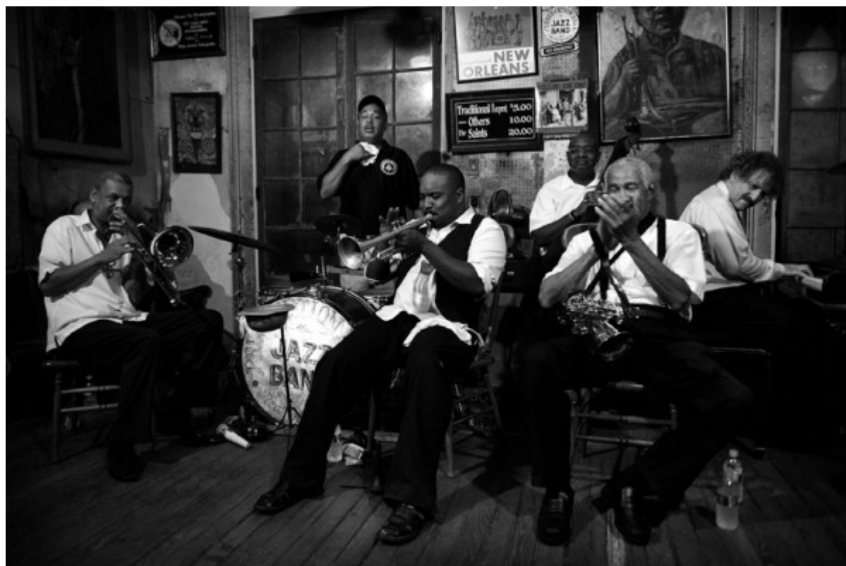
Orchestra Preservation Hall © by Esther Cidoncha, New Orleans 2012

De viaje por Nueva Orleans nuestro primer club de jazz visitado fue el legendario Preservation Hall. Antes del concierto navegamos en el barco a vapor Nachez, un paseo de cuatro horas por el grandioso e histórico río Mississippi viendo el atardecer azul-rosado del cielo. Es un local muy curioso que hay que conocer, imposible ir a Nueva Orleans y no acudir al Preservation Hall. Totalmente recomendable.