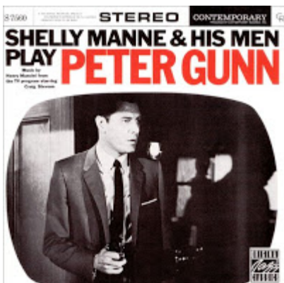
Shelly Manne & His Men. Play Peter Gunn . Contemporary. 1959