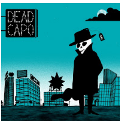
Dead Capo. Sale . LoveMonk. 2012