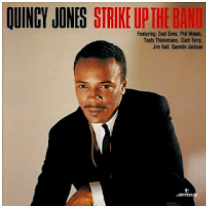
Quincy Jones. Strike Up The Band . Mercury. 1964