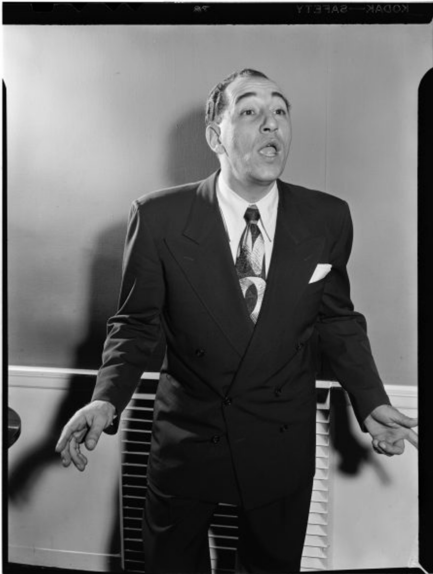
Louis Prima, 1947.