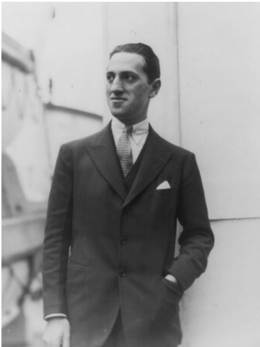
George Gershwin , en torno a 1920