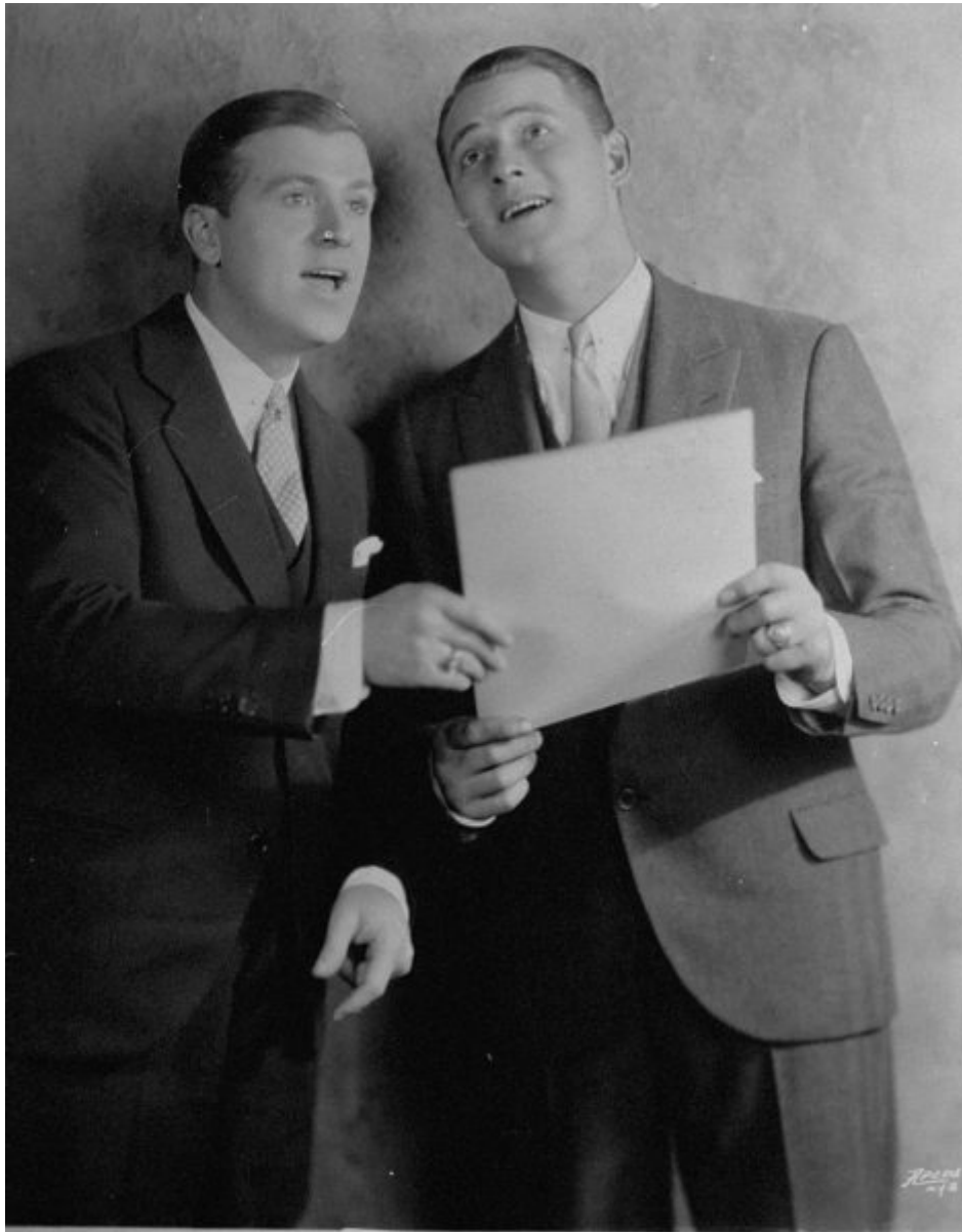
J. Fred Coots y Waite Hoyt, autores de "Santa Claus is Comin' to Town" (1933)