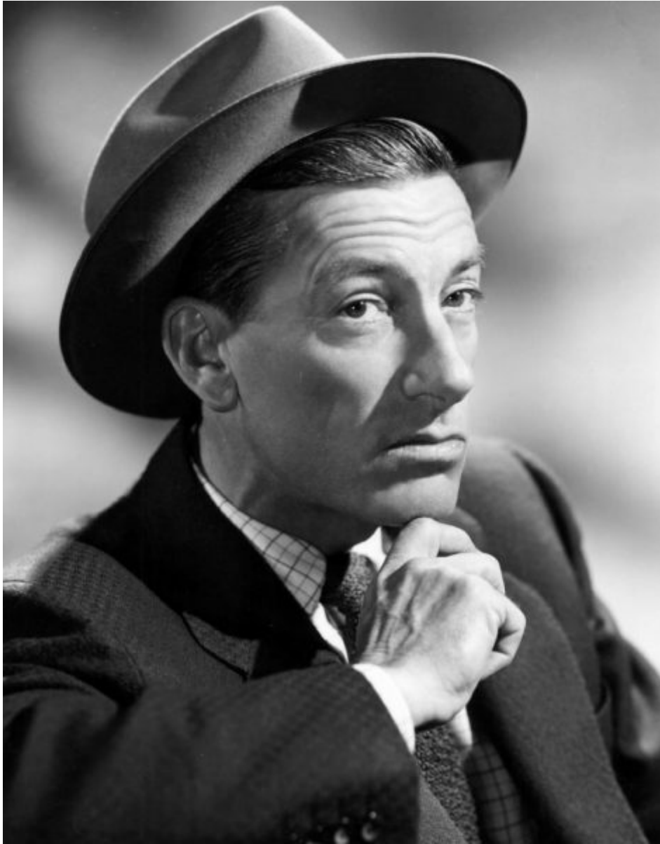
Hoagy Carmichael (1953)