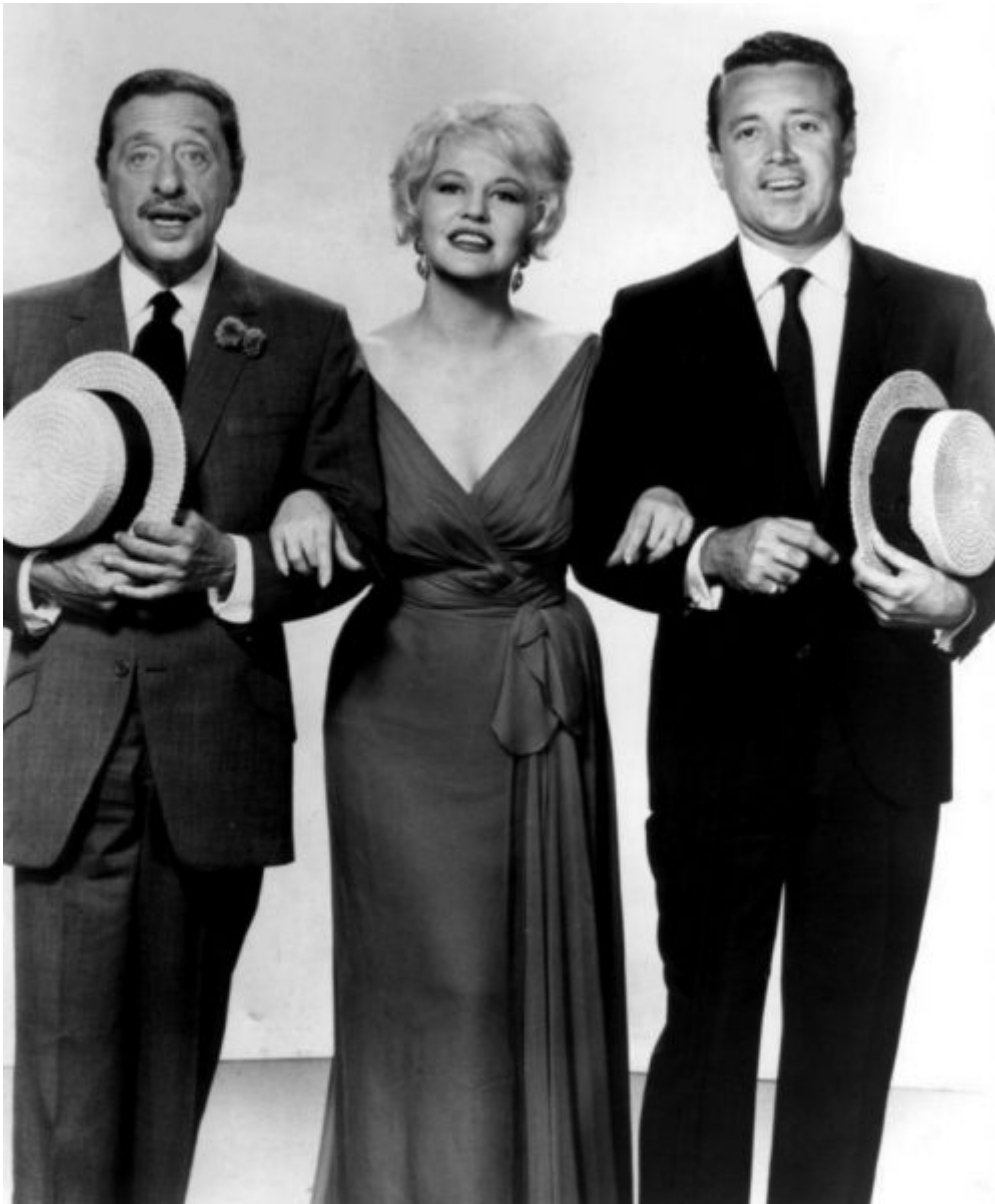
Harold Arlen (izquierda), Peggy Lee y Vic Damone