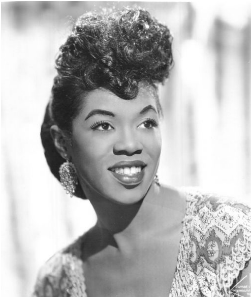
Sarah Vaughan