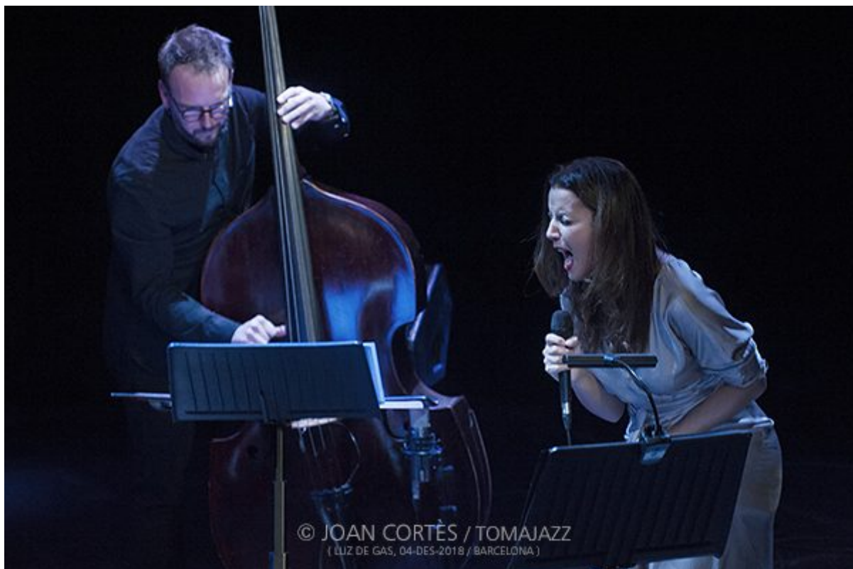
Mariola Membrives / La enamorada https://www.tomajazz.com/web/?p=41258