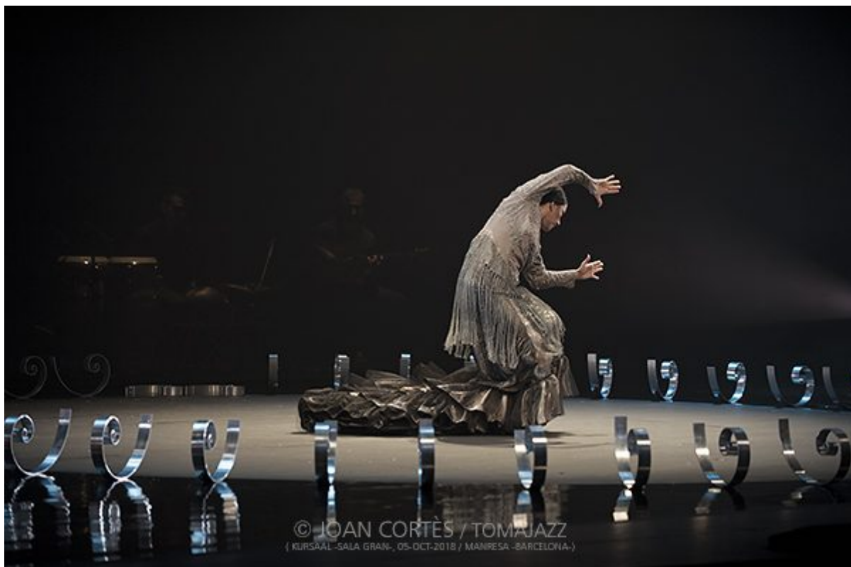
Eva Yerbabuena / Cuentos de azúcar https://www.tomajazz.com/web/?p=40331