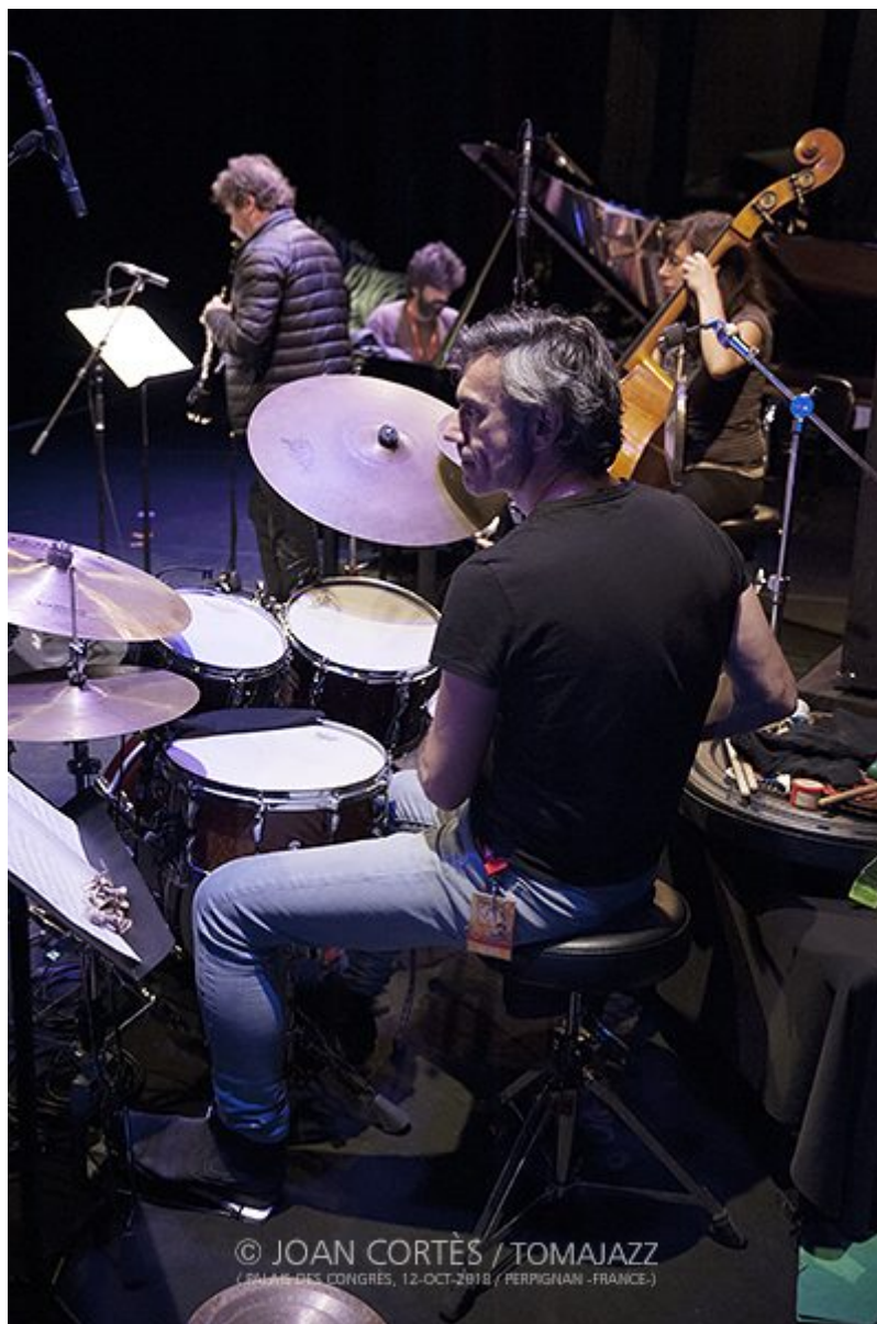
Louis Sclavis Quartet / Characters on a wall https://www.tomajazz.com/web/?p=40523