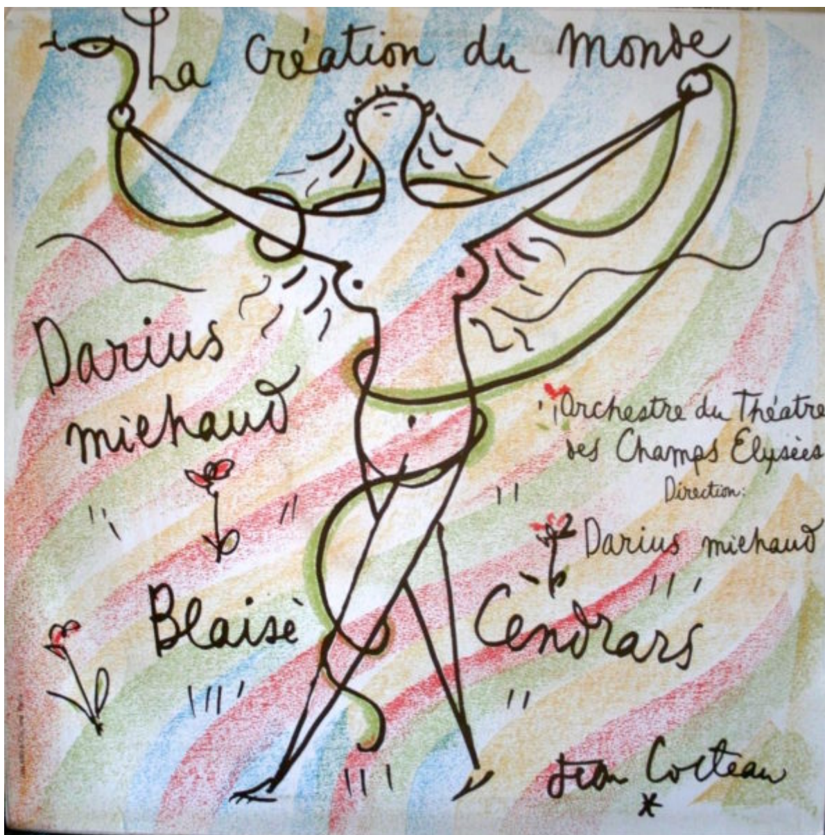
Cartel de Jean Cocteau para La creación del mundo .