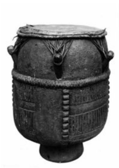
Tambor esclavo, Virginia siglo XVII. Colección British Museum, Londres.

Dizzy Gillespie fue adaptar los patrones rítmicos de la tumbadora a los establecidos en el bop . Pozo ya había tocado con otros músicos de jazz en La Habana, sabiendo adaptarse al toque del baterista y dejar los espacios necesarios para los solistas. Si bien la colaboración entre ambos músicos fue muy corta, poco más de un año, fue un pilar importante para sentar las bases de lo que en ese momento se llamó «cubop», y más tarde de manera más amplia y extendida «latinjazz».