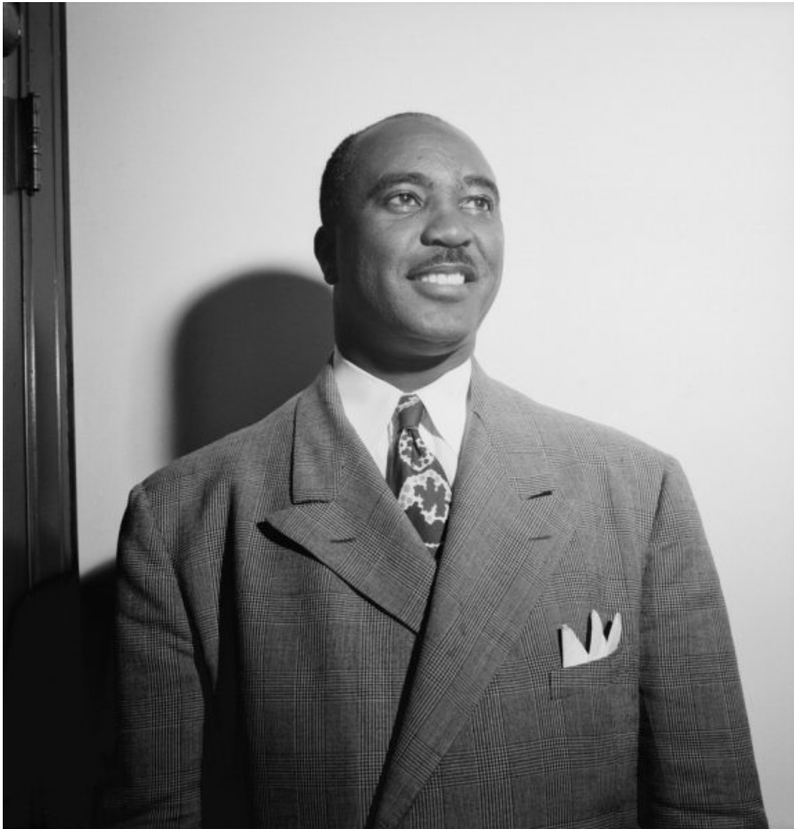
Jimmie Lunceford, ca. August 1946.