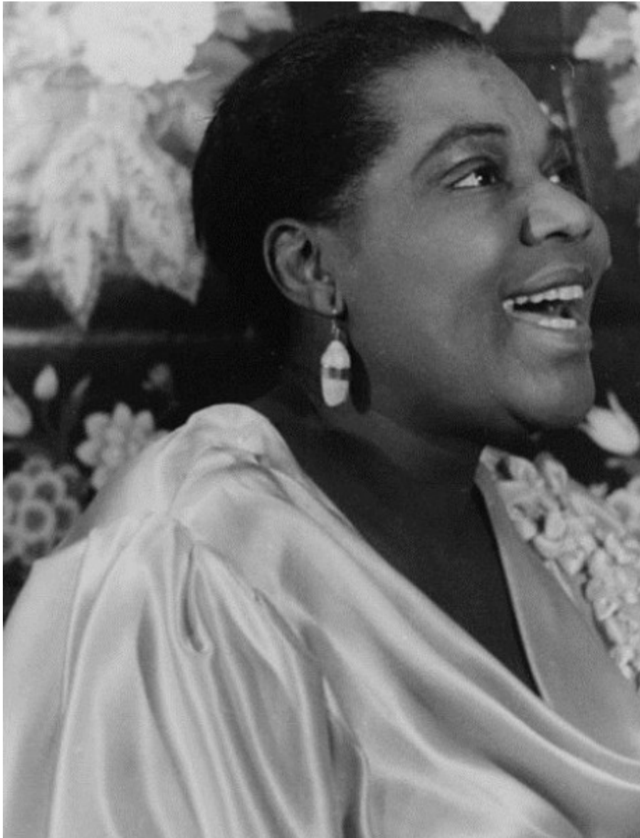
Bessie Smith by Carl Van Vetchen