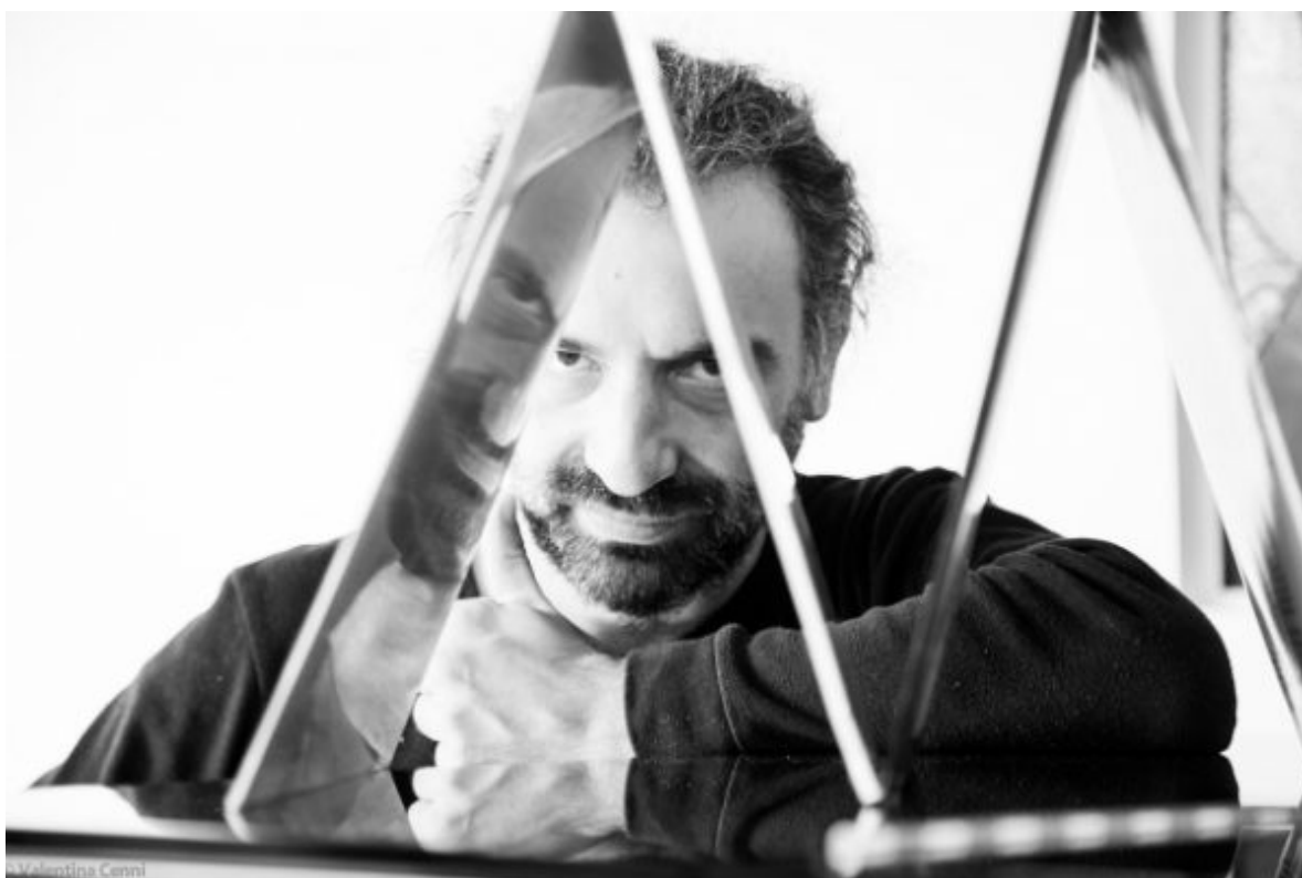
Stefano Bollani

El próximo sábado 4 de junio de 2016, a las 20:00, el pianista Stefano Bollani estrenará a piano solo su nueva grabación Napoli Trip . El concierto, con entrada libre hasta completar el aforo, tendrá lugar en Conde Duque. Toda la información en http://condeduquemadrid.es/evento/stefano-bollani/