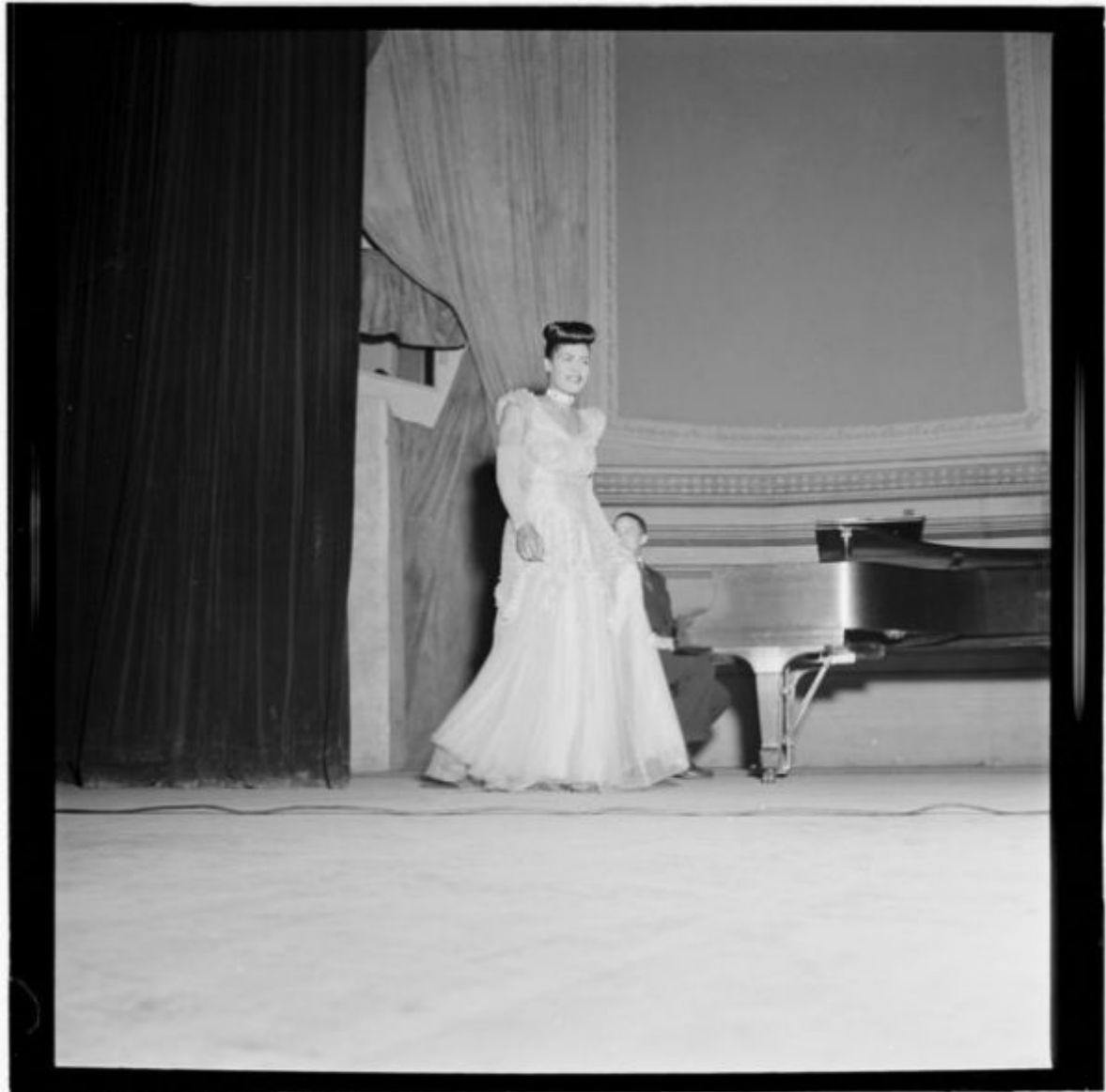
Billie Holiday, Carnegie Hall, New York, N.Y., between 1946 and 1948.