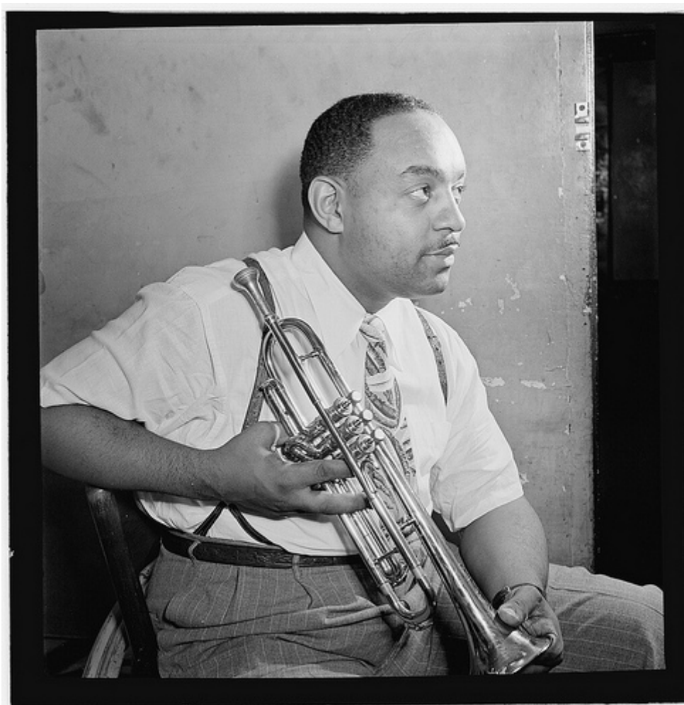
Benny Carter (Apollo Theater, 1946)

que tuvo gran popularidad en las décadas de los años 30, 40 y 50 del siglo XX. Dan de ello fe sus grabaciones en compañía de orquestas como las de Eddie Condon , Victor Young , o de su esposo el pianista Jess Stacy . Abren y cierran el programa la cantante Carmen Lundy y Clarence Gatemouth Brown .