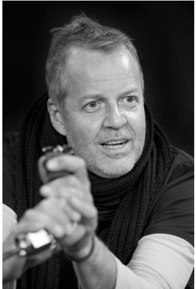
Wolfgang Haffner.

It has a sound which is connected to Ibiza in a way. My music has become more tranquilo over the years. I'm 47 years old and before I was touring around the world like crazy, playing sideman for a lot of people. Now I'm concentrating more and more on my own things. That's another part of why I moved to Spain: I wanted to leave my comfort zone. I was a session player for other people and I was touring a lot for other people, and now I said: "Well, I'm gonna get out of most of it, I wanna live somewhere else and start building a new life." And this means also I'm playing a little less because I'm concentrating more on my thing, so when somebody calls me and says: "Can you go on a big tour?" I first check whether there's anything I want to do with my band and, if not, I might do it. My own music is on the focus now, it's number one, and it wasn't number one in the past. It all started when