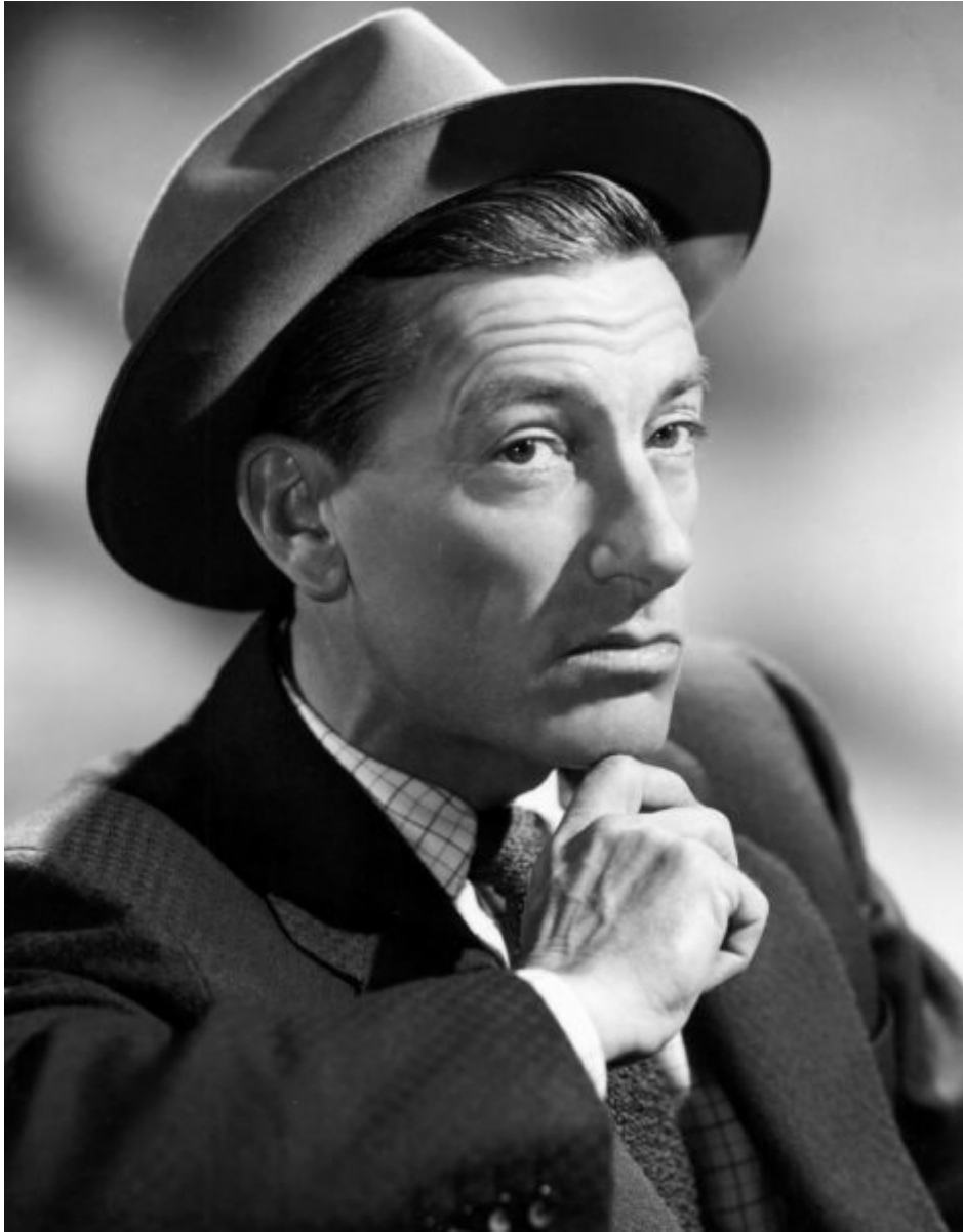
Hoagy Carmichael (1953)