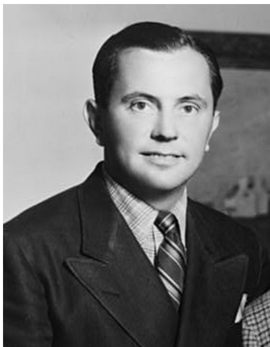
Retrato de Vernon Duke