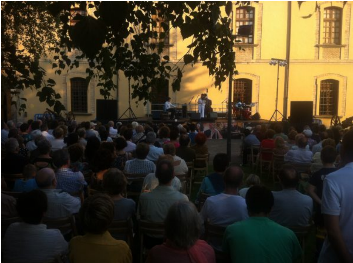
Jazz en la Calle 2015.

tuve que buscar por todas las floristerías en plenos sanfermines... Jonny Griffin en 2004, un leyendón. ¡El concierto de Chucho Valdes y Javier Colina en plenos sanfermines y un silencio que se respiraba! Tener a tres grandes como Joe Lovano , Dave Liebman y Ravi Coltrane en el escenario del JazzFermín . Otras grandes leyendas como Benny Golson y McCoy Tyner . Pedro Iturralde en varias ocasiones. De los últimos conciertos que yo organicé el de Chris Potter con Jason Moran fue espectacular, y también el concierto de Bill Evans . Justo en esos momentos escuchas una voz desde dentro que dice “merece la pena”. Son los que se quedan en la memoria para siempre. No puedo dejar pasar por alto los conciertos locales que han presentado sus proyectos en este escenario y por supuesto a nuestro querido Javier Colina , siempre ahí.