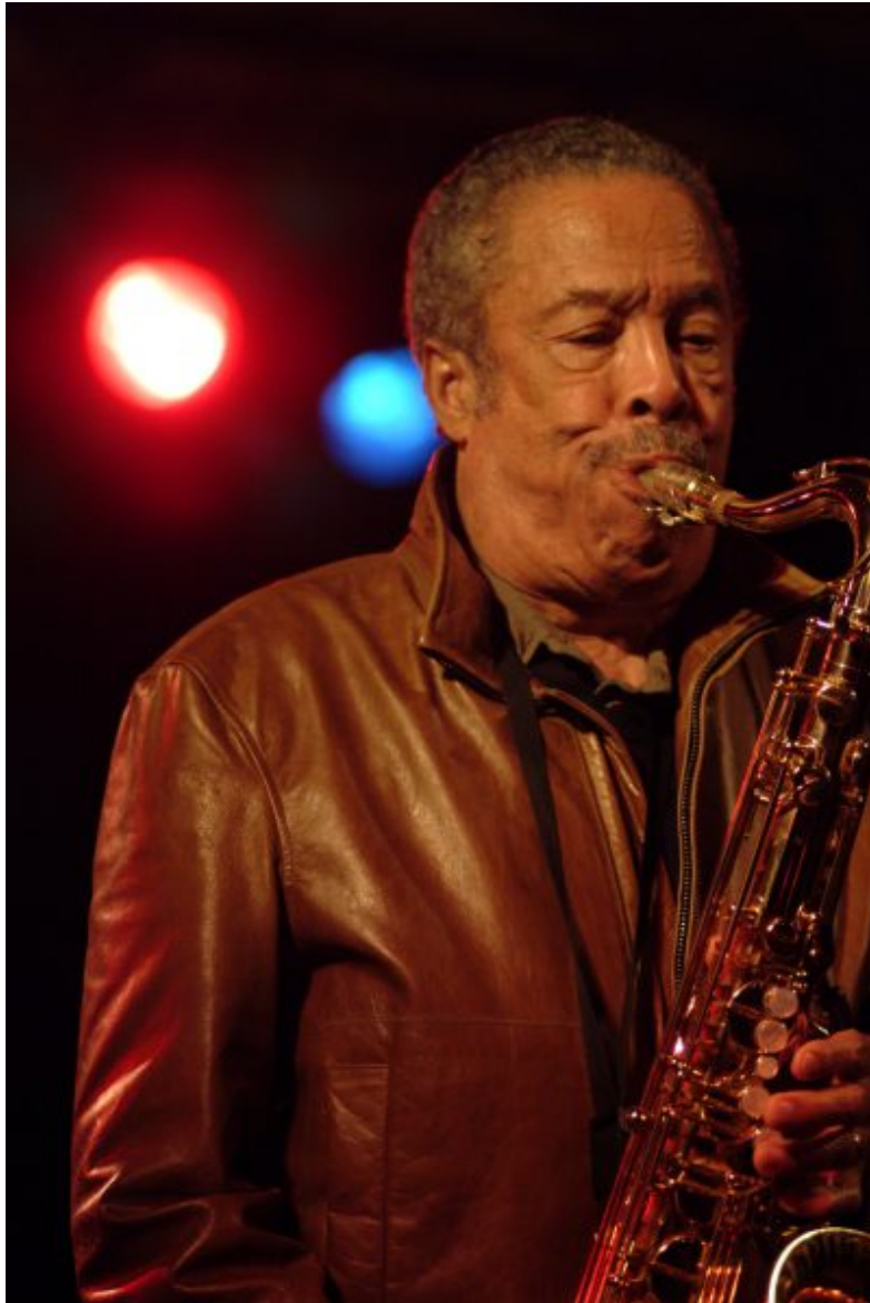
Johnny Griffin