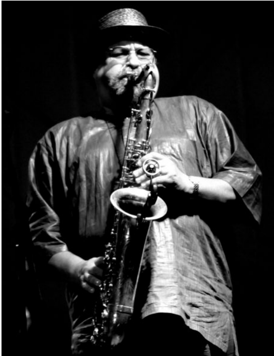
Joe Lovano. Fotografía © Yerbabuena

Pachi Tapiz – Tomajaz: ¿Cuántas veces has estado a punto de tirar la toalla? Desde fuera las cosas no se ven igual que desde dentro, y supongo -y algo sé también al respecto- que muchas veces no es fácil luchar contra los elementos... y no digo más.