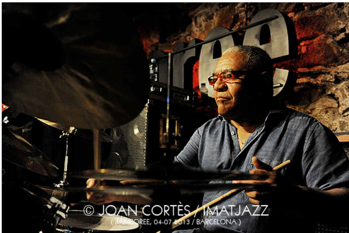
Ignacio Berroa Ignacio Berroa Quartet Jamboree, Barcelona. 2013-07-04