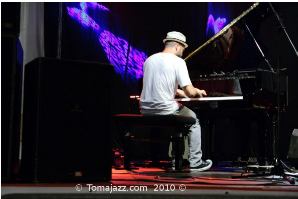
Jason Moran