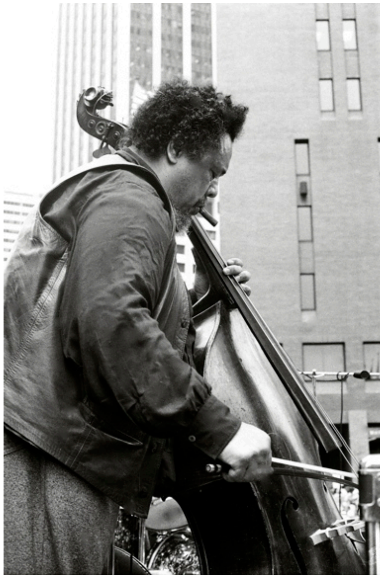
Charles Mingus. Bi Centennial, Lower Manhattan. 1976-07-04.