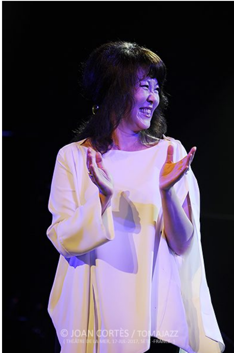
Tomajazz: texto y fotografías © Joan Cortès, 2017