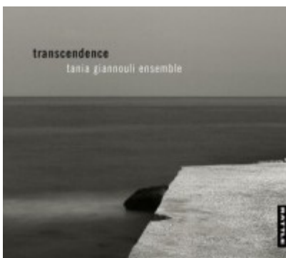
Tania Giannouli Ensemble: transcendence

HDO ( Hablando de oídas ) es un audioblog presentado, editado y producido por Pachi Tapiz.