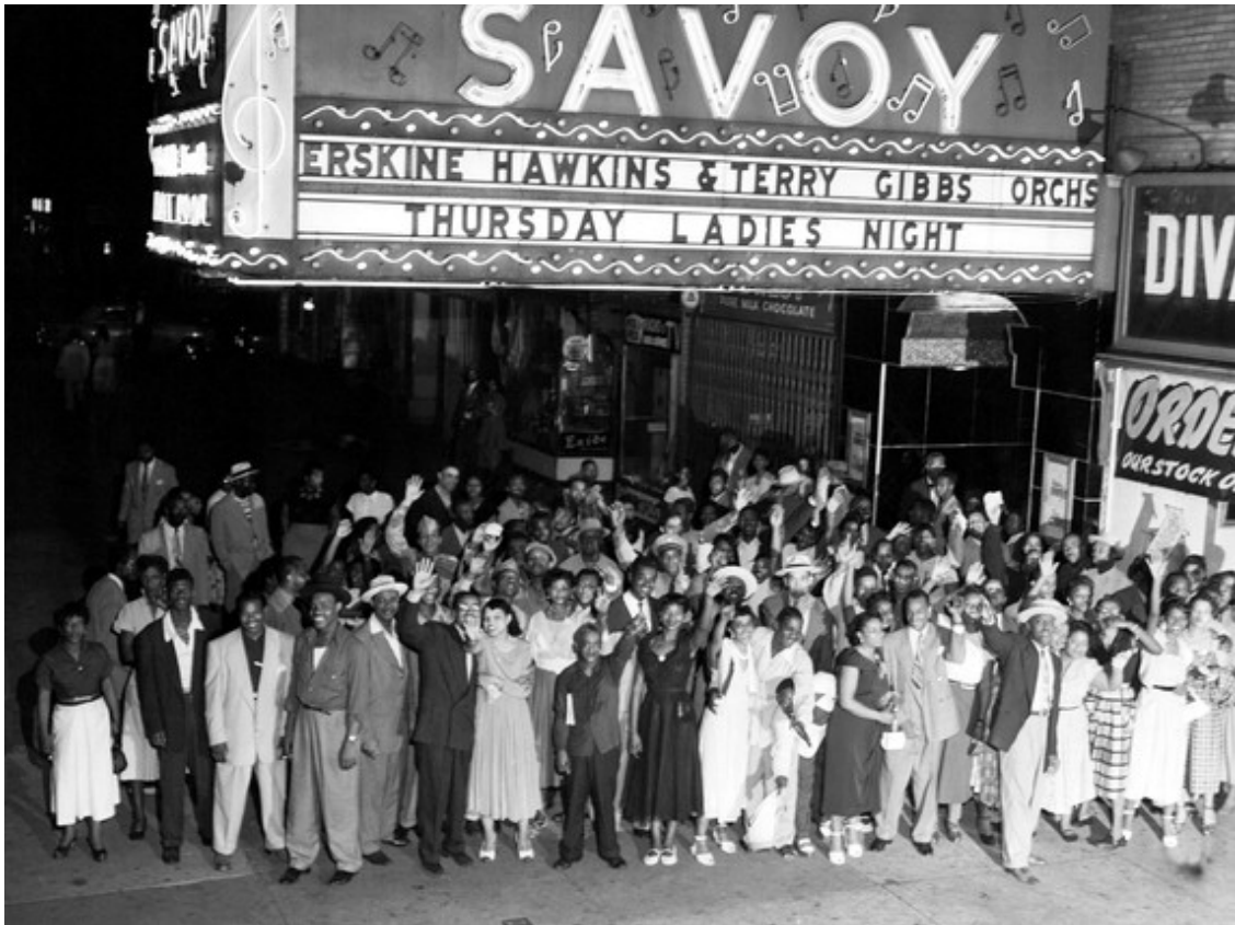
Savoy Ballroom 1952.