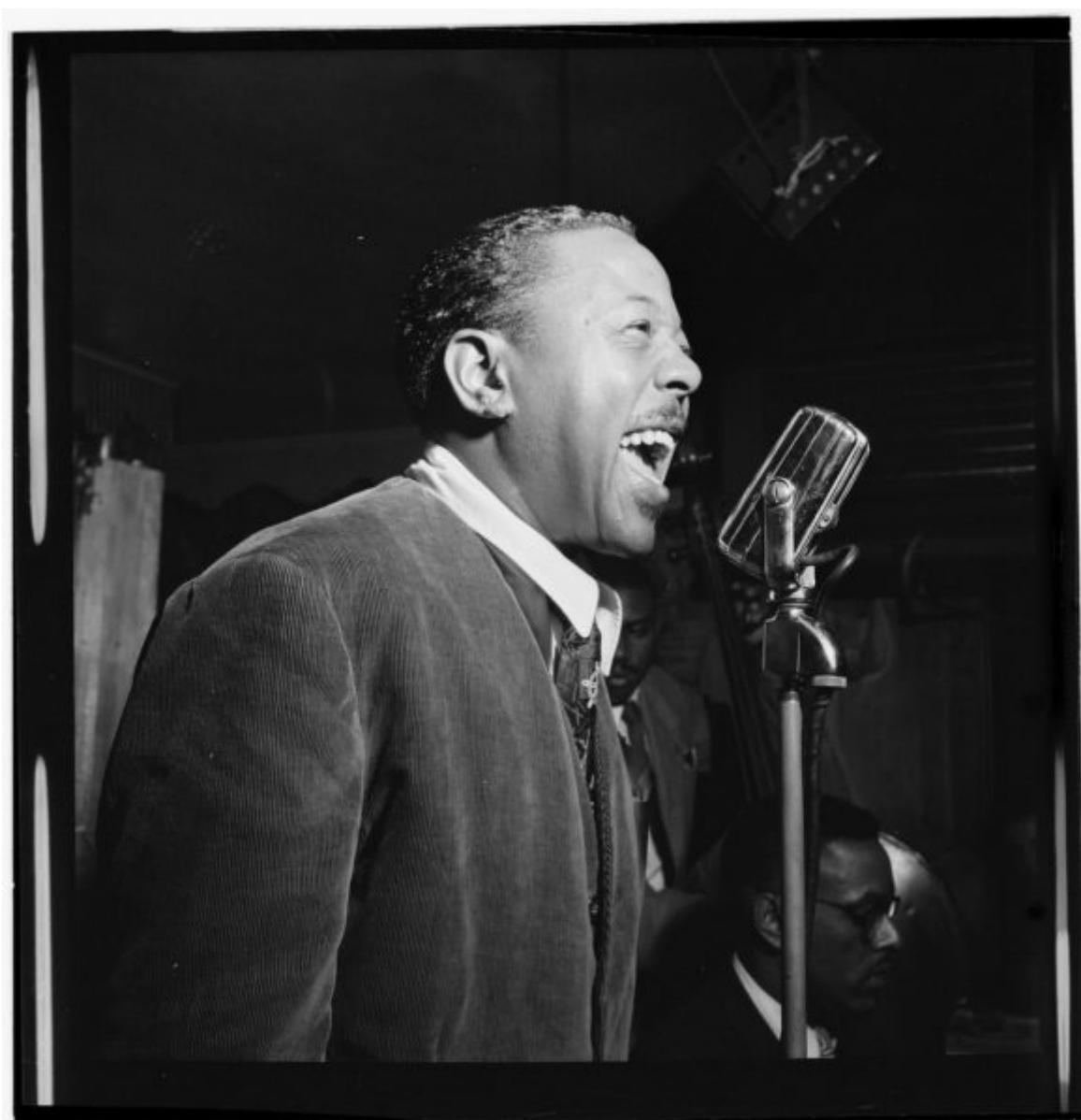
Roy Eldridge, Spotlight (Club), New York, alrededor de

Afroamericana continúa el repaso de algunas de las orquestas de la época del Swing . En concreto con las orquestas de dos músicos, con una gran historia a sus espaldas, y en muchas ocasiones en muy buenas compañías. Jay McShann dio una oportunidad al gran Charlie Parker , y suena en el programa acompañado por Helen Humes . El otro músico es Roy Eldridge , a quien acompañan Billie Holiday , Fletcher Henderson , Gene Krupa y Anita O'Day . Al contrario que en el resto de programas, en el inicio suena Carla Cook , y lo cierran Roy Eldridge & Co.