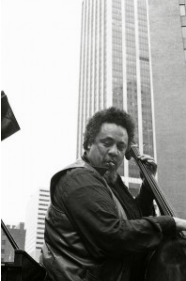
Charles Mingus. Bi Centennial, Lower Manhattan. 1976-07-04.