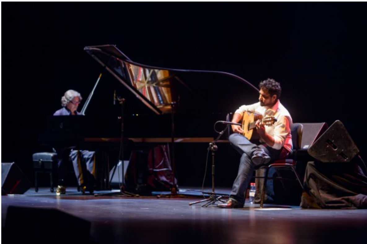
Chano Domínguez – Niño Josele

Niño Josele es un gran guitarrista de rancio abolengo, que no ha tenido ningún reparo en trabajar con otros artistas introduciéndose en géneros ajenos al flamenco. En manos de estos dos músicos los temas de Lennon y McCartney, John Lewis, Michel Legrand, Paco de Lucía (“Canción de amor”) o Joaquín Rodrigo (“Concierto de Aranjuez”) entre otros, quedan en un terreno en el que hay trazas de jazz, y también de flamenco, pero que no termina de decidirse ni por la libertad improvisatoria del primero, ni se deja llevar por la emoción y profundidad del segundo.