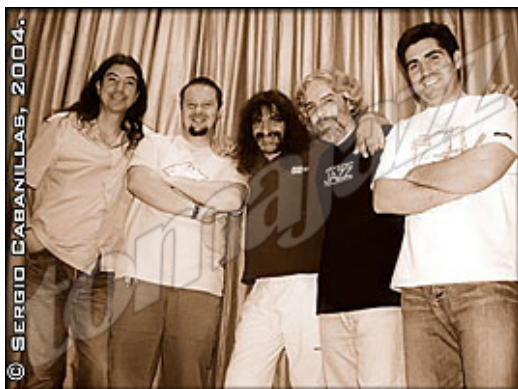
Juan Camacho Quinteto

Juan Camacho: ...y también con Pedro Iturralde, en su Modern Sax Quartet.