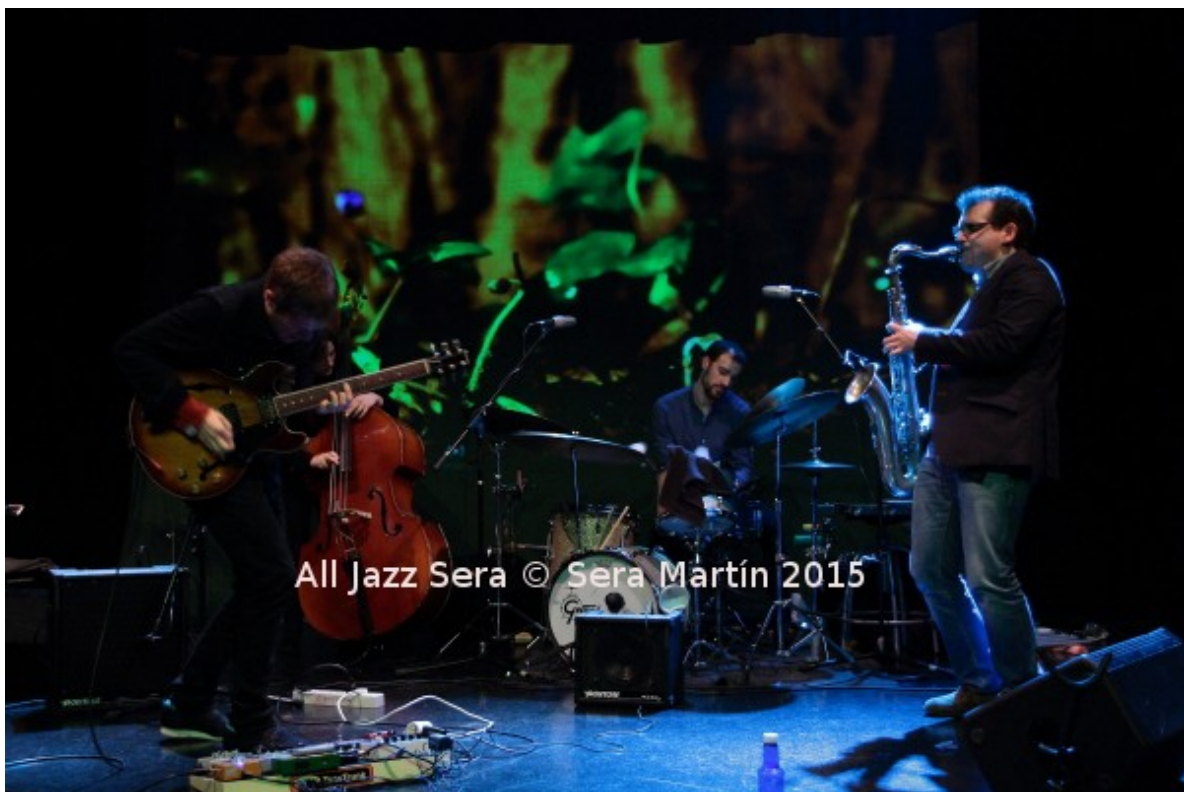
The Big Free Tongue

Como complemento al artículo “El jazz en Navarra en 2015: sangre nueva en el Viejo Reyno” publicado en Tomajazz, especial HDO con diecisiete temas de otras tantas formaciones y grabaciones que se mencionan en el artículo. Esta es la lista de temas que suenan: