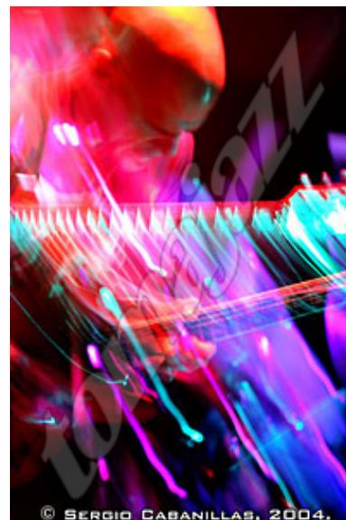
David Fiuczynski

David Fiuczynski: The level of education at Berklee College of Music is very high, with incredible, world reknown faculty. I graduated from New England Conservatory, and the education one can get there is also very rigorous and complete. However, those are really the only two institutions that I have spent enough time at to really comment on.