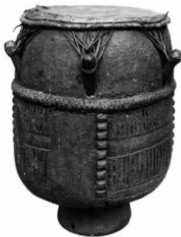
Tambor esclavo, Virginia siglo XVII. Colección British Museum, Londres.

Dizzy Gillespie fue adaptar los patrones rítmicos de la tumbadora a los establecidos en el bop . Pozo ya había tocado con otros músicos de jazz en La Habana, sabiendo adaptarse al toque del baterista y dejar los espacios necesarios para los solistas. Si bien la colaboración entre ambos músicos fue muy corta, poco más de un año, fue un pilar importante para sentar las bases de lo que en ese momento se llamó «cubop», y más tarde de manera más amplia y extendida «latinjazz».