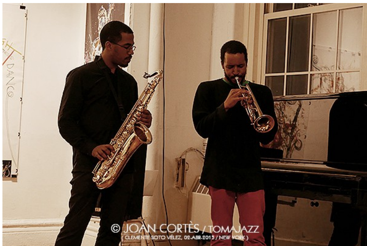
(CLEMENTE SOTO VÉLEZ, 02-ABR-2015 / NEW YORK)