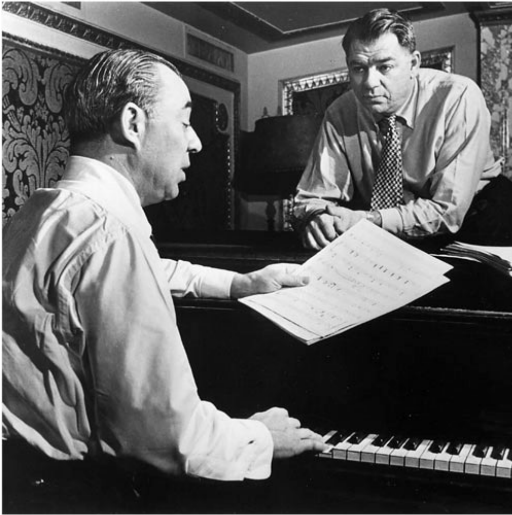
Richard Rodgers (sentado al piano), con Oscar Hammerstein II, en una fotografía de 1945.