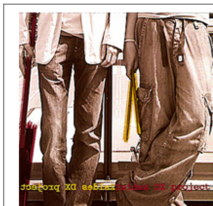
2Sides DX Project Satchmo Records, 2006