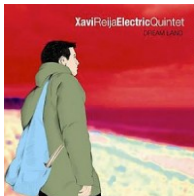
Xavi Reija Dream Land Xavi Reija, 2006