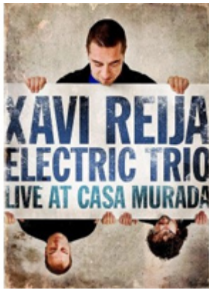
Xavi Reija Electric Trio Live At Casa Murada (DVD) Xavi Reija, 2009