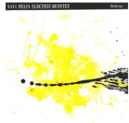
Xavi Reija Electric Quintet Rithual L'Indi Records, 2008