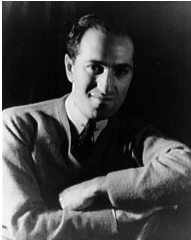
George Gershwin (Fotografía: Carl van Vetchen, 1937)