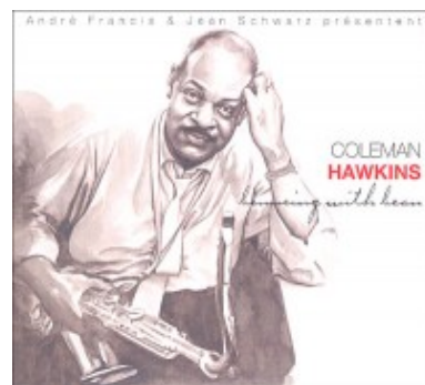
Coleman Hawkins. Bouncing With Bean

La colección de temas de 2015 no recurre a algo tan natural como pudiera ser añadir a lo ya publicado en 2005 un tercer CD con temas que se hayan liberado de los correspondientes derechos en los diez años transcurridos entre una y otra colección. Todo lo contrario. El doble CD de 2005 finalizaba en el año 1949, mientras que el triple CD de 2015 finaliza en el primero de esos CD en ese año, centrando el grueso de la obra en las grabaciones a partir de 1950. También hay que resaltar que si bien hay obras que resultan ineludibles en una recopilación que se precie de Coleman Hawkins como son el histórico tema en solitario "Picasso" de 1948, o su magistral versión de "Body And Soul" de 1938 (un tema que vendió miles y miles de copias, y que es una obra maestra absoluta), no hay muchos más temas que coindican en ambas grabaciones. Por tanto, estamos ante dos obras complementarias que permiten disfrutar de uno de los grandes del saxofón, un músico imprescindible en la historia del jazz y que sirvió de fuente de inspiración a gigantes de la talla de Sonny Rollins y Archie Shepp.