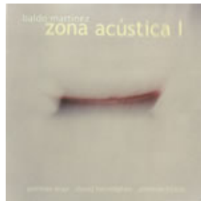
Zona Acústica I