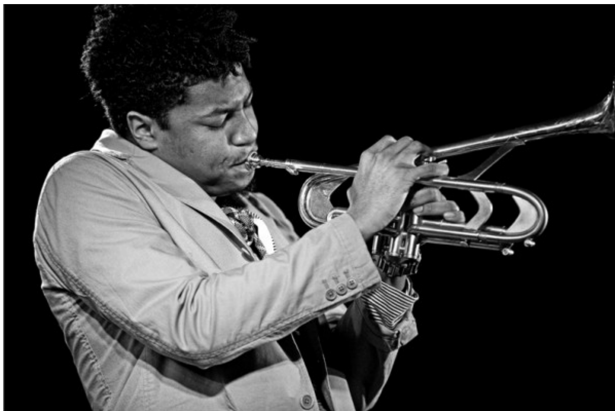
Christian Scott