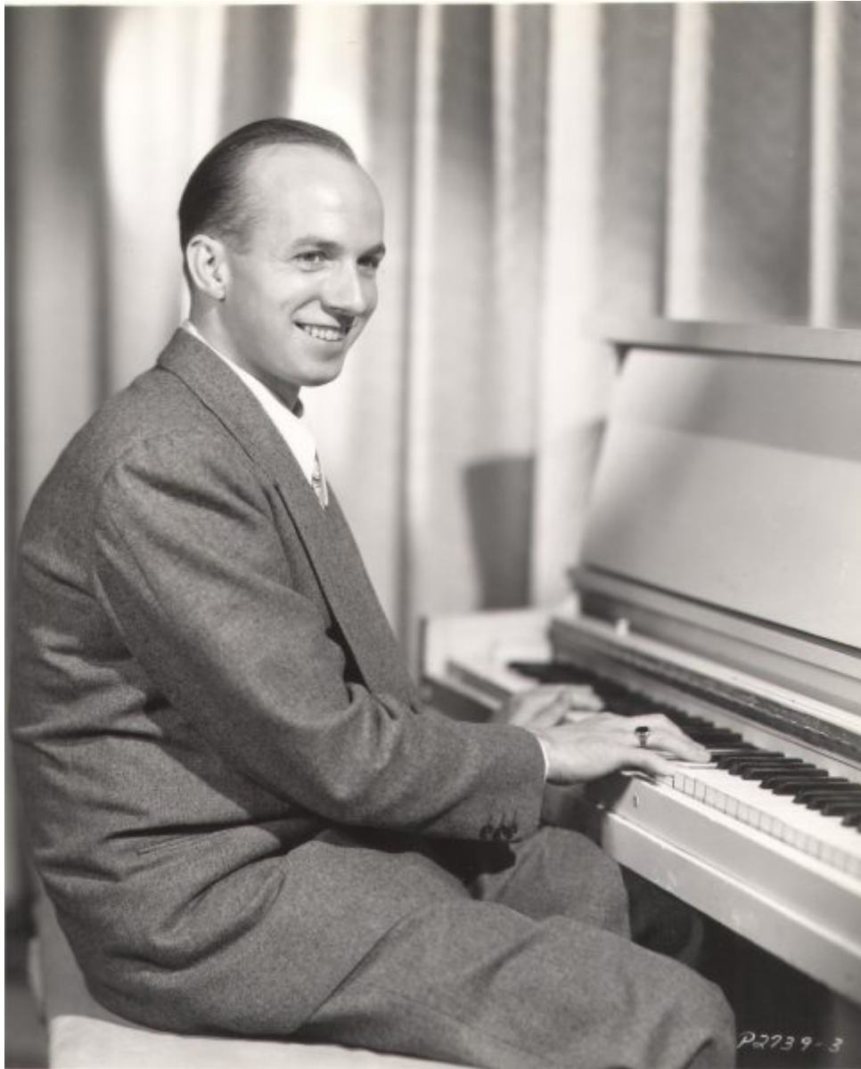
Jimmy Van Heusen al piano