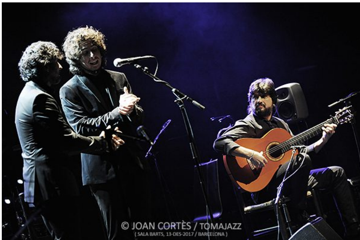
( SALA BARTS, 13-DES-2017 / BARCELONA )