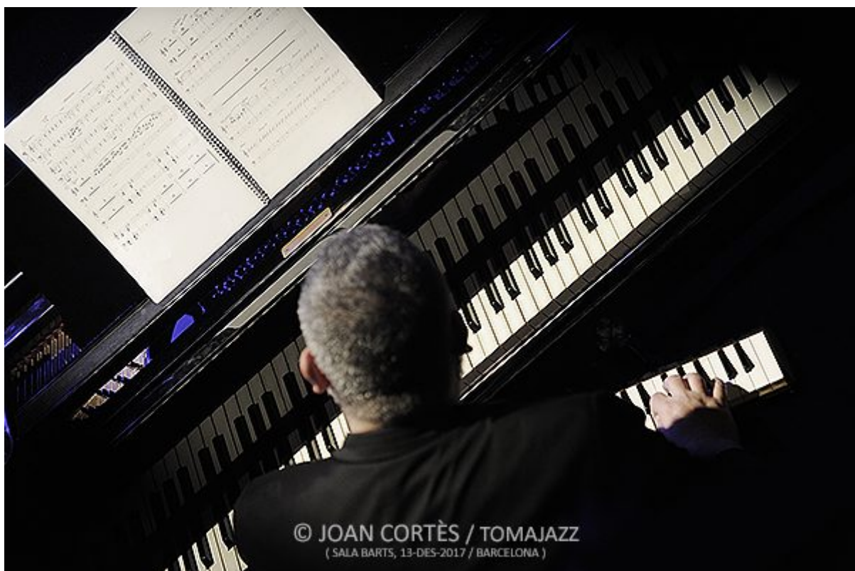
( SALA BARTS, 13-DES-2017 / BARCELONA )