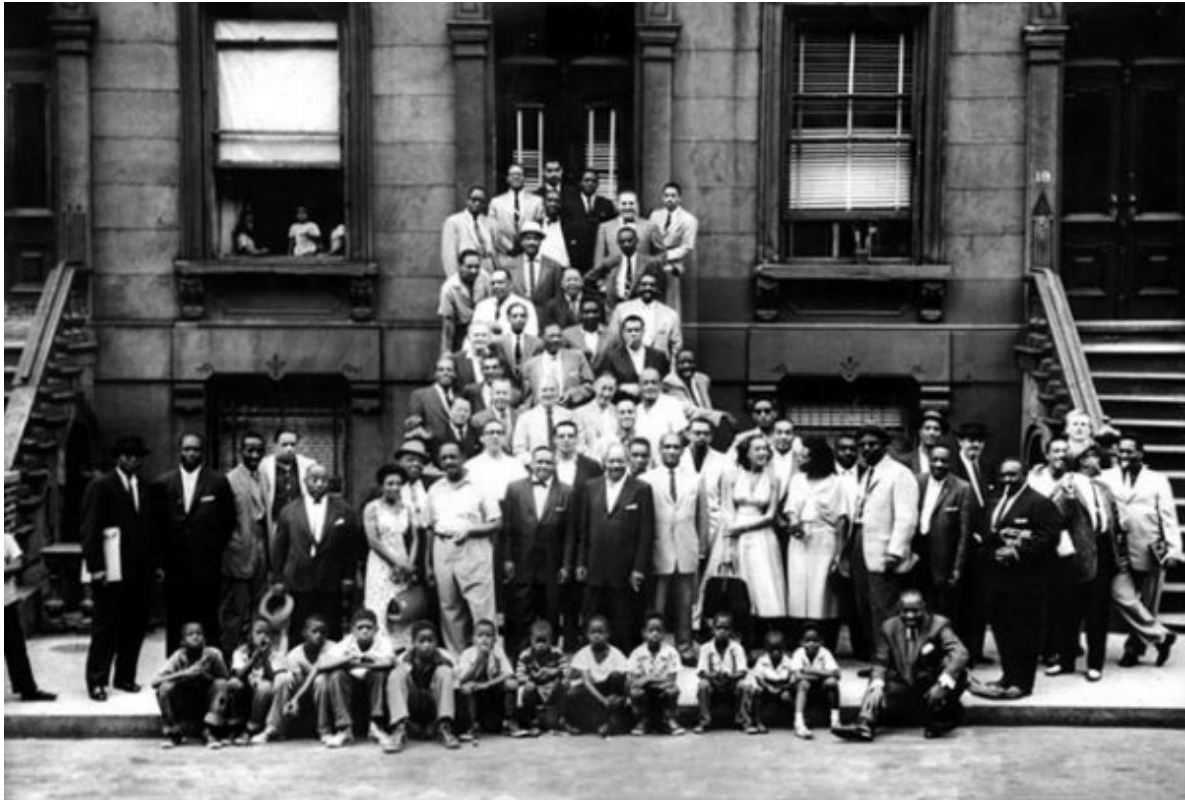
A Great Day in Harlem o Harlem 1958. Fotografía por Art Kane.

uno de los primeros rags escritos por un afroamericano. Ilustra la entrada la famosa fotografía “A Great Day in Harlem” o “Harlem 1958” del fotógrafo Art Kane.