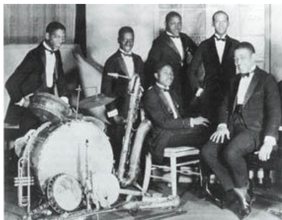
The Washingtonians, 1925

(1930) pasó a ser el tema de presentación de la banda (sustituyendo así a “East St Louis”); años después aún tocaban “The Mooche”, “Creole Love Call” (la versión original, de 1927, incluía la voz, sin letra, de Adelaide Hall) y “Black Beauty” (dedicado a Florence Mills, el primero de una larga serie de retratos). “Haunted Nights” (1929) presentaba una sección de cañas que incluía únicamente a Barney Bigard (1906-1980), Harry Carney (1910-1974) y Johnny Hodges (1907-1970), pero sonaba más numerosa; en “Mood Indigo” (1930), cuenta con el clásico sonido de la melodía interpretada por una mezcla de Nanton, Bigard y Whetsel (de vuelta en la banda), mostrando la formidable habilidad de Ellington como arreglista –ya había empezado a componer especialmente para músicos concretos– como juez infalible de las habilidades de cada uno. En 1930 la banda incluía a Whetsel, Cootie Williams (1910-1985) y Freddy “Posey” Jenkins (1906-1978) a las trompetas; Nanton al trombón, Juan Tizol al trombón de pistones (Vicente Martínez, 1900-1984); Hodges, Carney y Bigard en las cañas; Guy al banjo, aunque luego se pasó a la guitarra; Wellman Braud al bajo; Greer a la batería: todos ellos virtuosos, y la mayoría miembros intermitentes de la banda durante décadas.