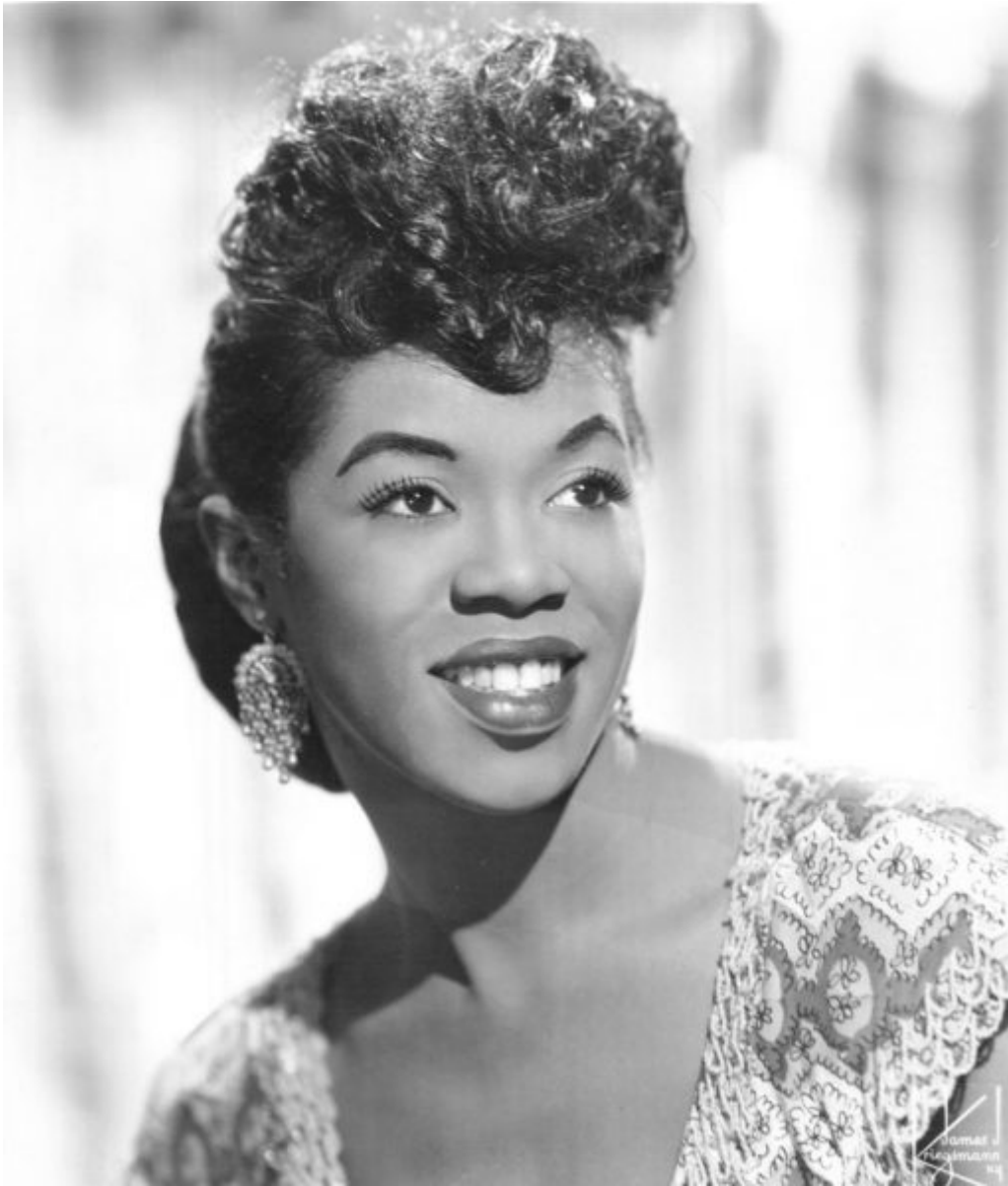
Sarah Vaughan fotografiada por James Kriegsmann en 1955. Fotografía de dominio público.