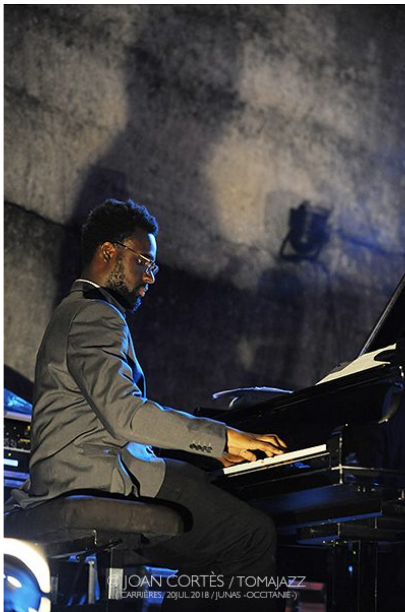
(CARRIÈRES, 20 JUL 2018 / JUNAS - OCCITANIE)