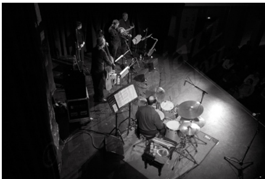
Sir Charles + 4 en el San Juan Evangelista (Madrid), 2010

tipo de gente que va: si son todos aficionados del jazz o también les gusta la música clásica. Lo que si es cierto es que tenía un miedo enorme a la respuesta de la gente. Cuando tocamos después de Tánger en el Imaxina Sons del 2007 en Vigo, a la gente le encantó y descansé porque no sabía bien como se iba a tomar el proyecto. Gustó mucho y esto me animó a seguir en la brecha.