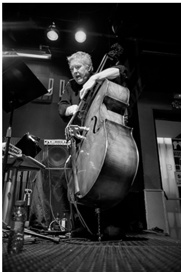
Arild Andersen

folk. Si captas la simplicidad de la música folk de Noruega en tus propias composiciones y la empleas como una herramienta sobre la que improvisar, creo que eso da mucha fuerza a la música.