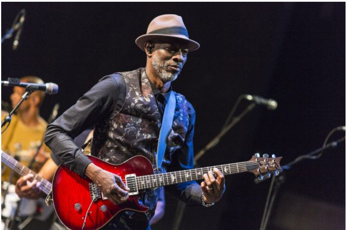
Keb' Mo'. Concierto de TAJMO el 14 de julio en el XX Festival de Jazz de San Javier