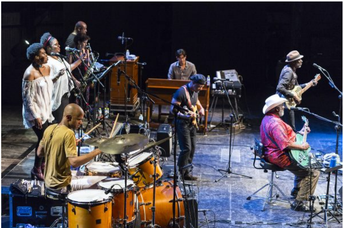
Concierto de TAJMO el 14 de julio en el XX Festival de Jazz de San Javier