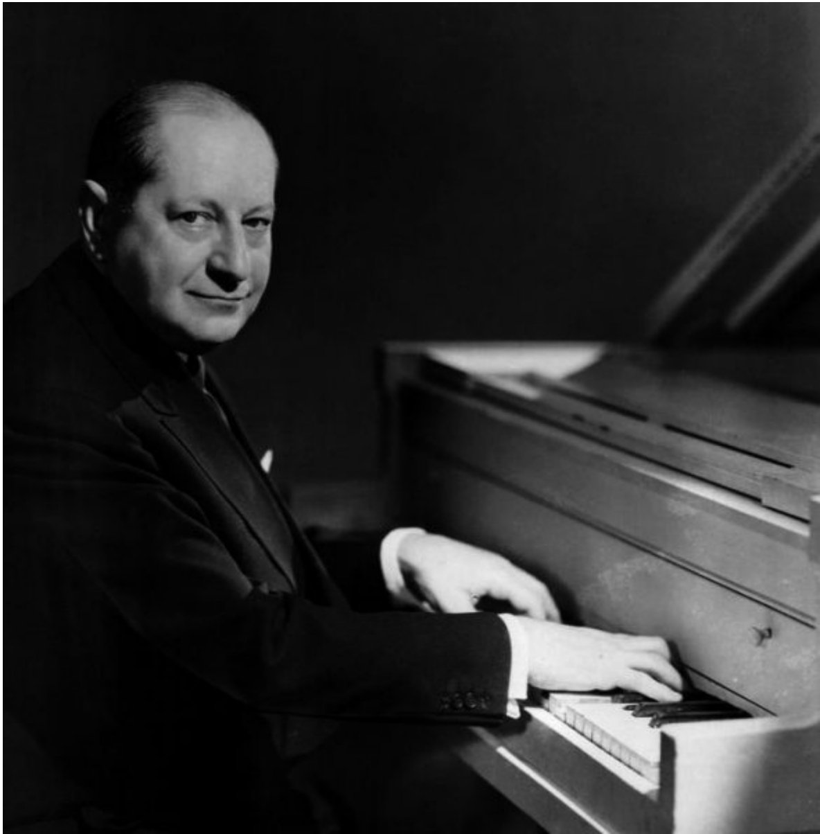
Sigmund Romberg en 1949