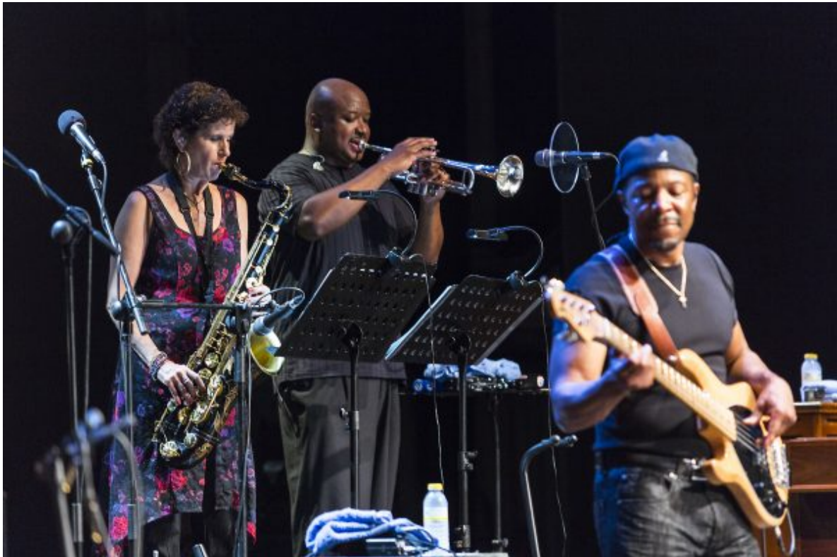
Concierto de TAJMO el 14 de julio en el XX Festival de Jazz de San Javier

El gran atractivo para muchos seguidores de Jazz San Javier, en la jornada del 14 de julio, fue el concierto protagonizado por dos figuras relevantes del blues , Taj Mahal y Keb' Mo'. Cualquier motivo puede ser bueno para reunir a estos dos gigantes, aún más cuando ambos preparan juntos un nuevo álbum, un recopilatorio con los temas más emblemáticos de cada uno. Un aforo casi al completo esperaba expectante el comienzo del concierto.