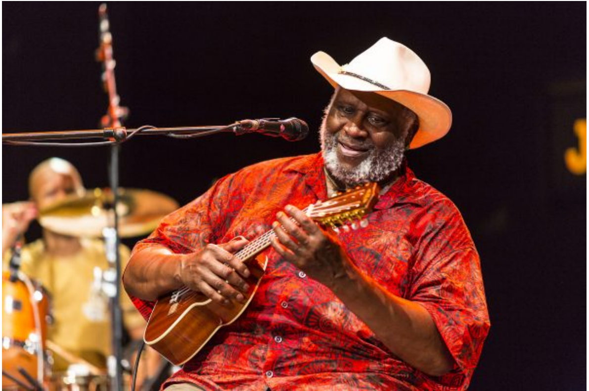
Taj Mahal. Concierto de TAJMO el 14 de julio en el XX Festival de Jazz de San Javier