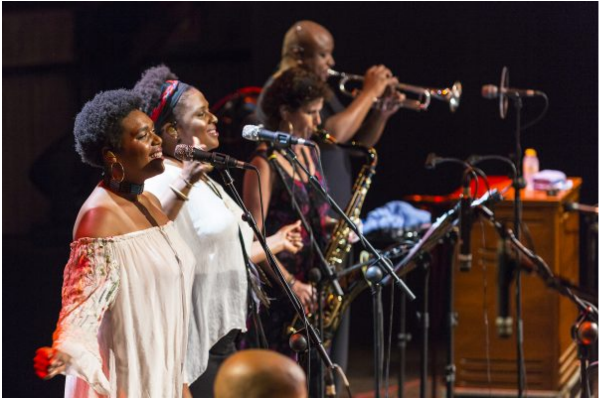
Concierto de TAJMO el 14 de julio en el XX Festival de Jazz de San Javier