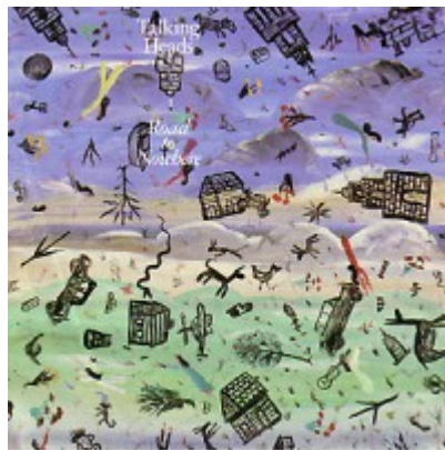
“Road To Nowhere”

Talking Heads Little Creatures Warner Bros. / Sire – EMI (1985)