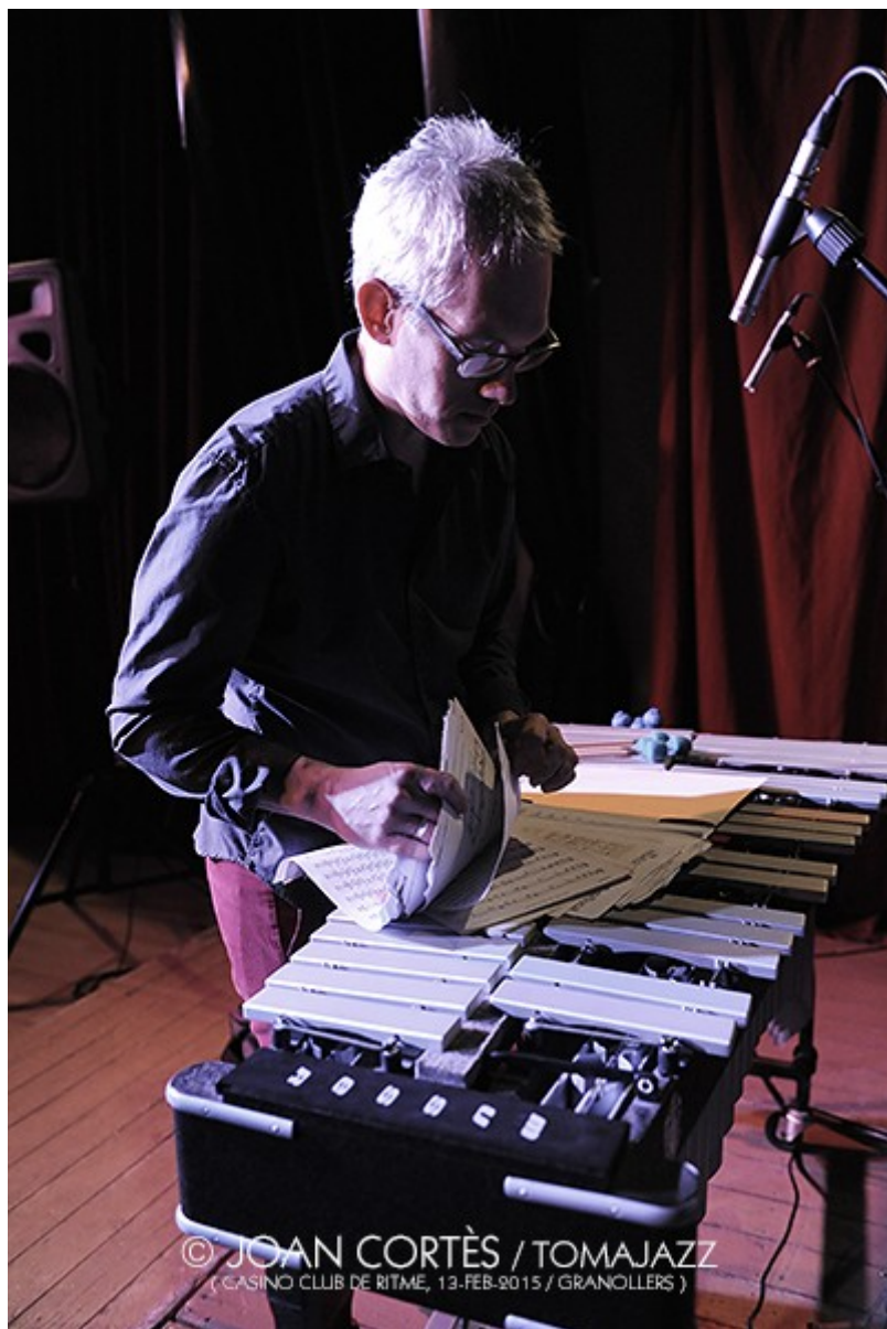
(CASINO CLUB DE RITME, 13-FEB-2015 / GRANOLLERS)