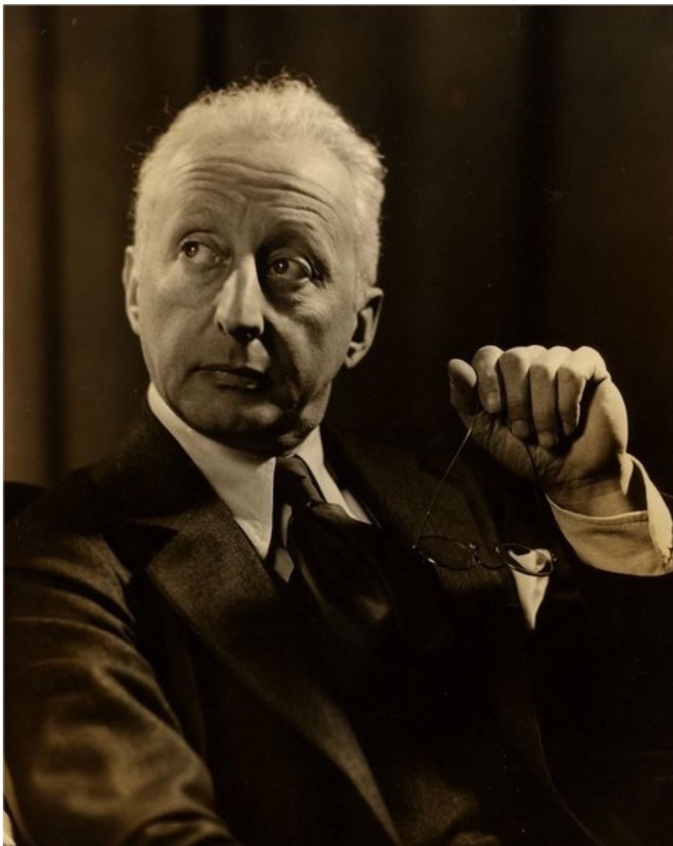
Jerome Kern en los años 30.