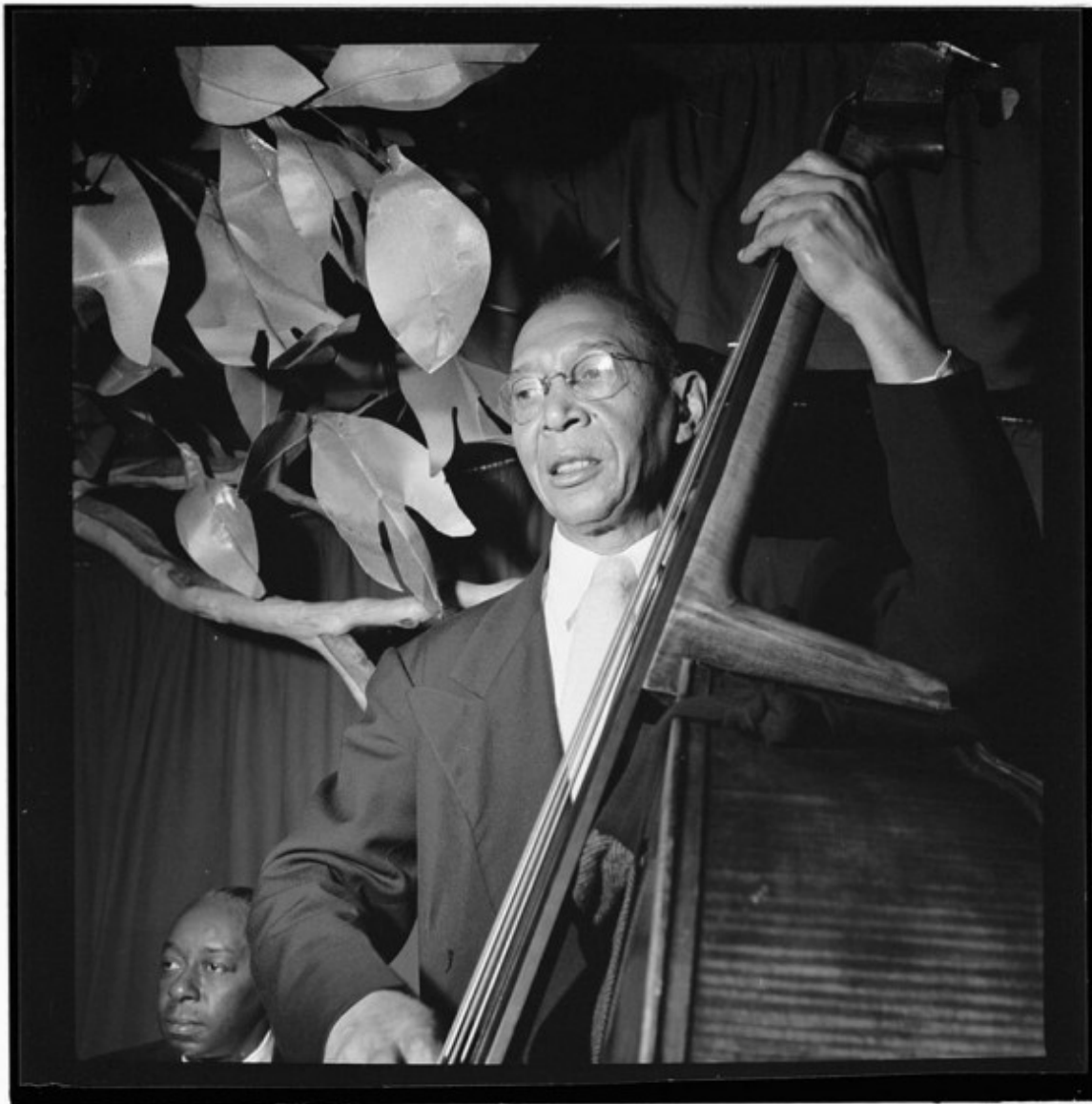
Portrait of Pops Foster, Ole South, New York, N.Y. 1947.