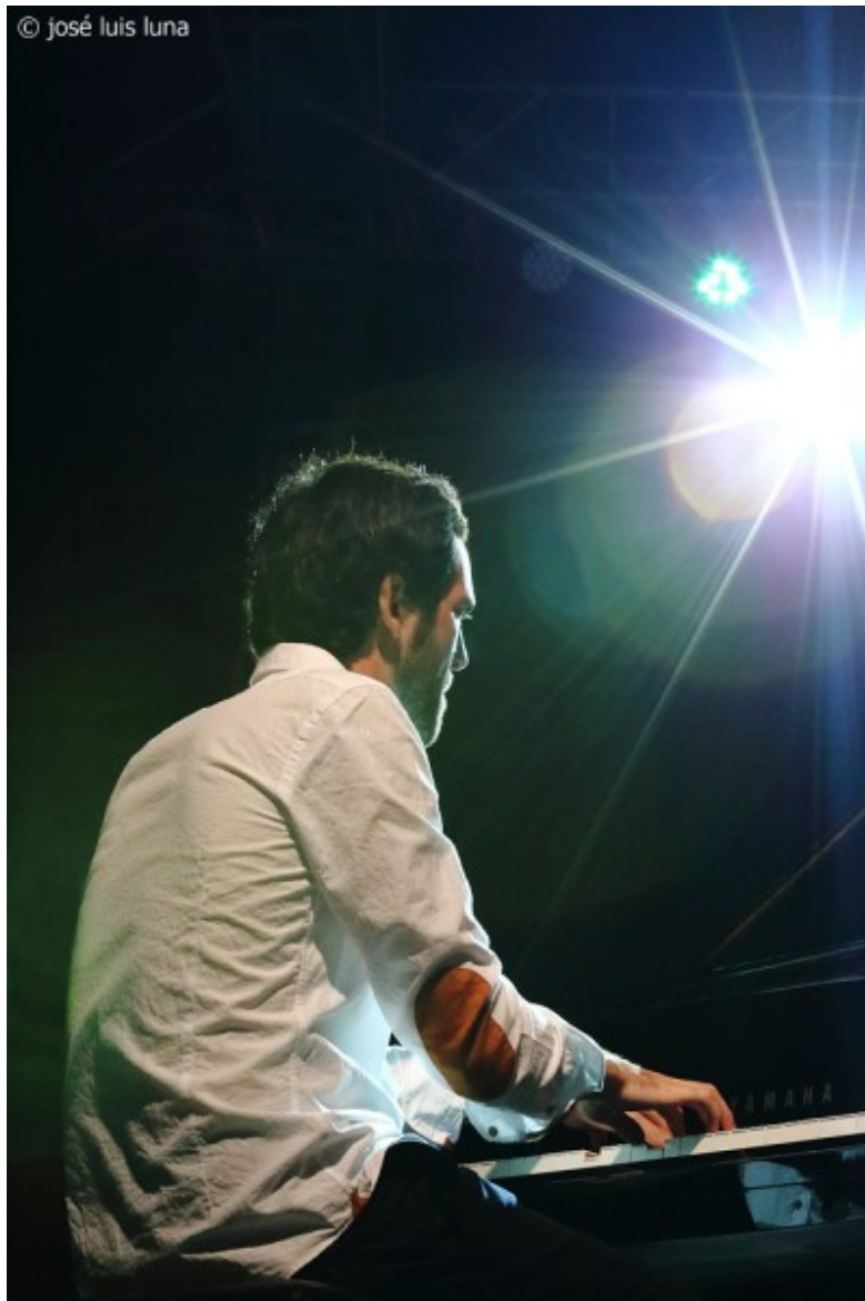
Threejay. Joan Solana

trabajo y que según ellos mismos “invita al optimismo”, ( Threejay , Quadrant Producciones , 2014). Este año todo lo que tocaron fueron temas propios, sin versiones como el año pasado.