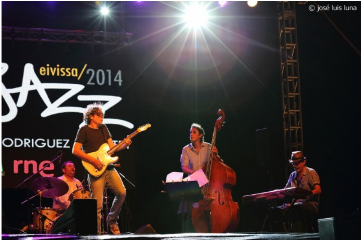
Norberto Rodríguez Quartet