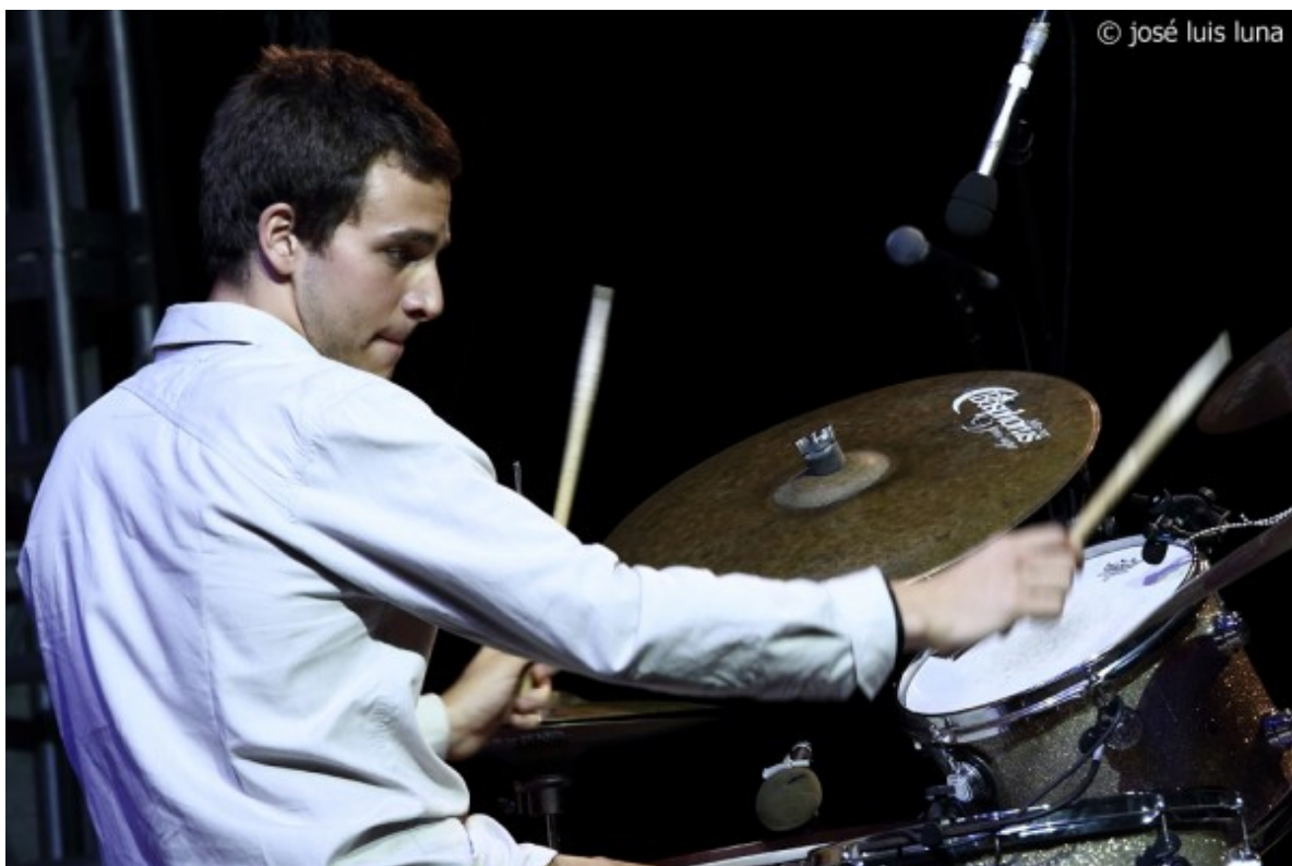
Threejay.

En la tercera y última jornada del Eivissa Jazz 2014 estaba prevista la actuación de Benny Golson , pero por problemas familiares el compositor de "I Remember Clifford", entre otras, se vio obligado a suspender su concierto. El encargado de llenar su hueco fue Perico Sambeat , todo un acierto. Pero no adelantemos acontecimientos.