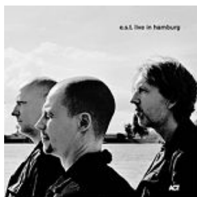
e.s.t. – Live In Hamburg ACT 6002-2

(1) E.S.T. apareció en la portada de la revista estadounidense Downbeat en mayo de 2006, siendo el primer grupo de jazz europeo que aparecía en dicha portada.