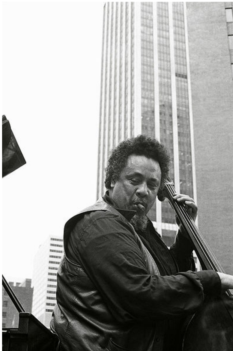
Charles Mingus. Bi Centennial, Lower Manhattan. 1976-07-04.